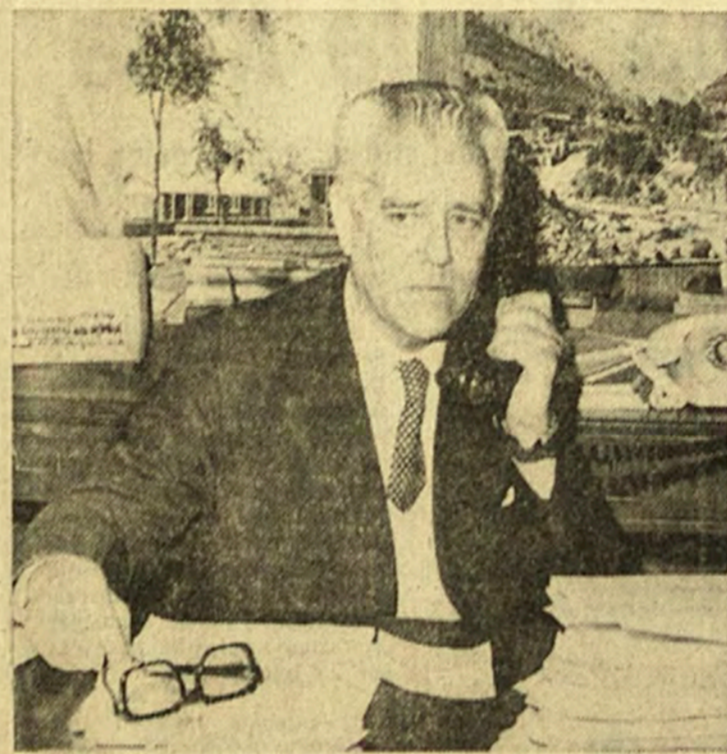
Ernesto Pinto Lagarrigue.

Que aún cuando ocupó los más altos cargos públicos, supo mantener una profunda humildad,