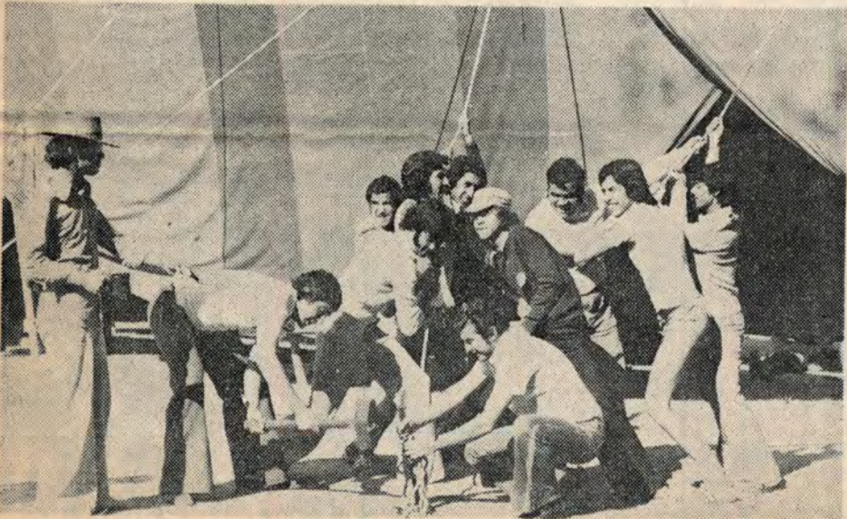
Jóvenes de Iquique, haciendo gala de buen humor, arreglan y afirman la gran carpa en la cual se albergan. "Aquí todos debemos cooperar", dijeron.