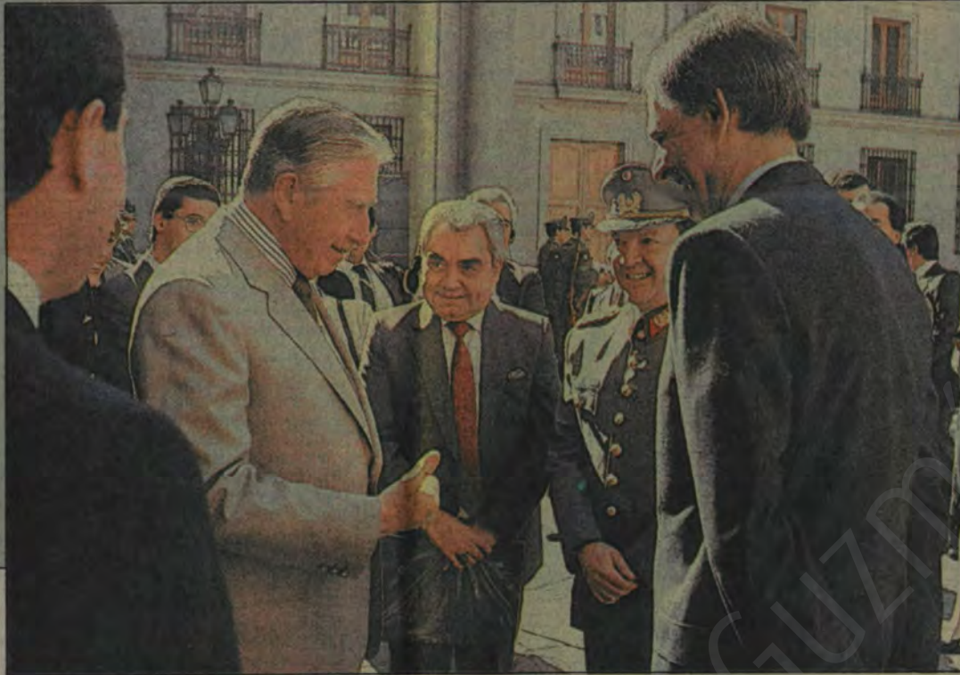
Durante la mañana, los ánimos estaban tranquilos: Pinochet departe en el patio con algunos colaboradores.

En medio de los focos de la televisión y la avidez de noticias fueron rodeados por los periodistas. Las palabras más elocuentes fueron las del general Matthei, quien afirmó a la entrada: "me parece que realmente ganó el «No». Al menos para mí, yo lo tengo bastante claro". Hay que reconocer el triunfo del «No». Y acerca de lo que esto significaba para el Gobierno dijo que se iba a analizar la situación. Merino, por su parte, declaró que iba a ha-