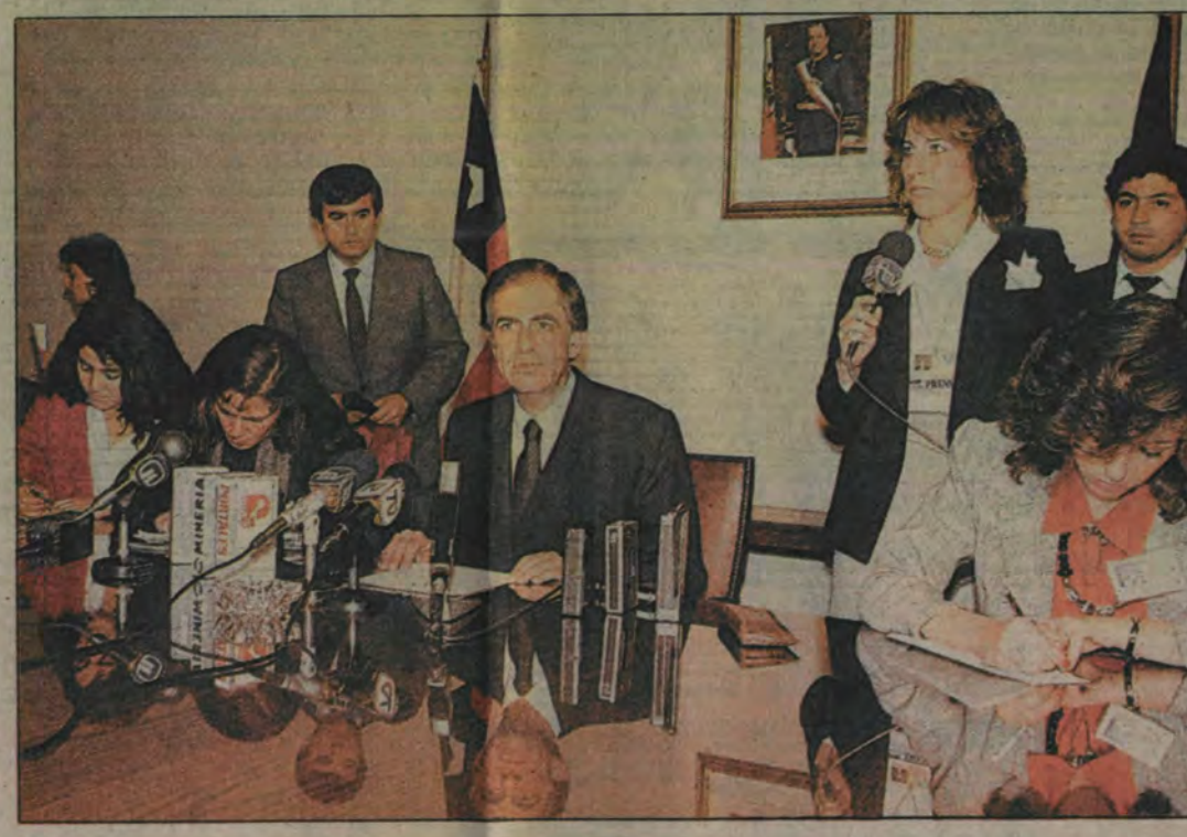
El ministro del Interior, Sergio Fernández, lee la declaración en que acata el triunfo del «No».

blar con el Presidente. Que todo había sido limpio, claro y en calma y que había estado esperando todo el día esa hora para recibir información.