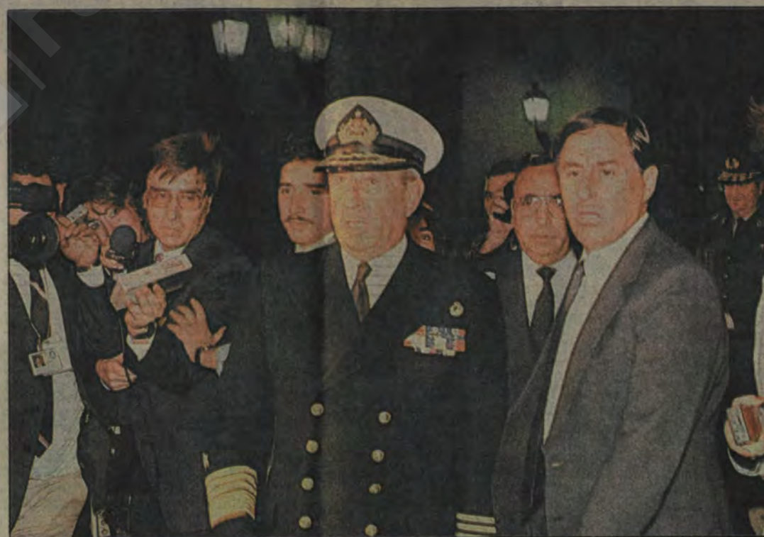
La expectación ante la llegada de Merino, Matthei y Stange.