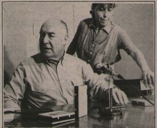
El presidente de Renovación Nacional, Sergio Onofre Jarpa, señaló que jamás ha intentado compararse con el Presidente Pinochet, de quien él es su partidario.

Jarpa dijo que en ese sentido reconocía "que ha sido una gran falla nuestra, porque si estas peloterías ocurren en el Partido Demócrata Cristiano o en el Partido Socialista la gente dice "bueno ése es su estilo". Pero el estilo aquí debe ser de seriedad, de respeto mutuo y de acatamiento