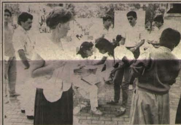
En la Plaza de Armas de nuestra capital la juventud del Partido Radical efectuó ayer un acto de recolección de firmas para la colectividad que dirige Enrique Silva Cimma.

OVALLE.- Treinta y siete comités cívicos se organizaron en la extensa comuna de Monte Patria, provincia de Limari, promoviendo a todo nivel el apoyo al "sí" en el próximo plebiscito.