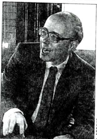
PROPUESTA. — El presidente de la Unión Demócrata Independiente (UDI), Jaime Guzmán, dio a conocer propuesta de reformas constitucionales elaborada por su colectividad.