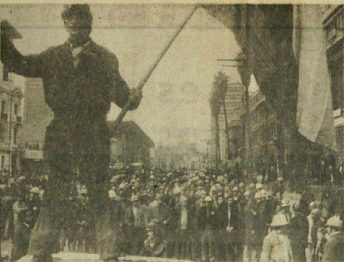
Este minero, con su equipo de trabajo y enarbolando una bandera chilena, trepó sobre la cabina de una camioneta y encabezó la "Marcha de la Democracia" que congregó a millares de personas en la Avenida Bulnes

El paso de las multitudes interrumpió el tránsito por la Alameda de oriente a poniente y viceversa y otro tanto ocurrió en las calles Miraflores, Mac Iver, Santa Rosa, San Francisco, Arturo Prat, San Diego, San Antonio, Estado, Ahumada, Bandera y otras que desembocan en Bernardo O'Higgins. Piquetes policiales, premunidos de sus cargas de bombas lacrimógenas, se apostaron en todas las esquinas, pero en ningún momento debieron intervenir. La marcha fue tranquila, sin incidentes,