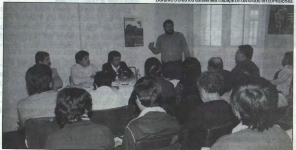
Durante 3 días los asistentes trabajaron divididos en comisiones.