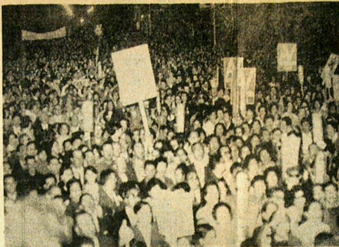
ALESSANDRI: Su discurso más violento para oír sus presentaciones en Talcahuano, donde volvieron a registrarse incidentes.

SOCIEDAD PERIODISTICA BIO BIO LIMITADA CONCEPCION (CHILE) — Martes 24 de marzo de 1970 AÑO XLVII — Nº 16.657 — PRECIO: E$ 1.— EDICION DE 12 PAGINAS — DOS CUERPOS