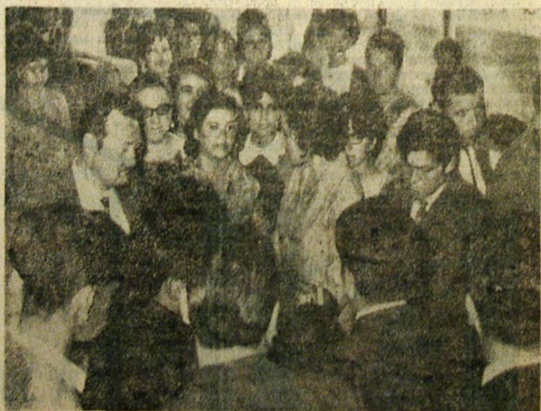
Similitud democrática: elecciones pa-... presencia está en la alegría que acompaña los actos en ese país.

Si estamos en otoño, las hojas han comenzado a perder su verdor,