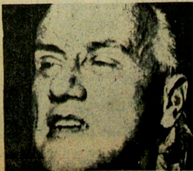
JORGE ALESSANDRI RODRIGUEZ

Al parecer el siniestro se inició a raíz de un cortocircuito en el entretecho del Séptimo Juzgado.