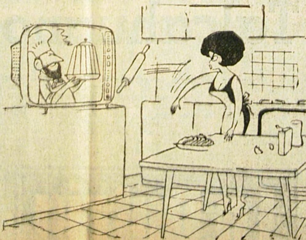
—¡Maldito Canal 4!... Hasta las recetas de cocina se sintonizan mal ahora en el televisor...—