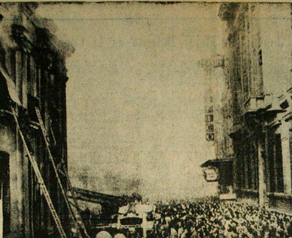
Tres juzgados ardieron en el centro de la capital como producto de un incendio.

BALCONES INDISCRETOS. — Los balcones de los modernos y altos edificios han sido ideales para presenciar en los últimos días las concentraciones políticas, sin riesgo de recibir nada. Pero el peligro está en que desde abajo, el panorama de los transeúntes se amplía, como lo registra esta nota gráfica que ha convertido las minifaldas de dos espectadoras en superminis.