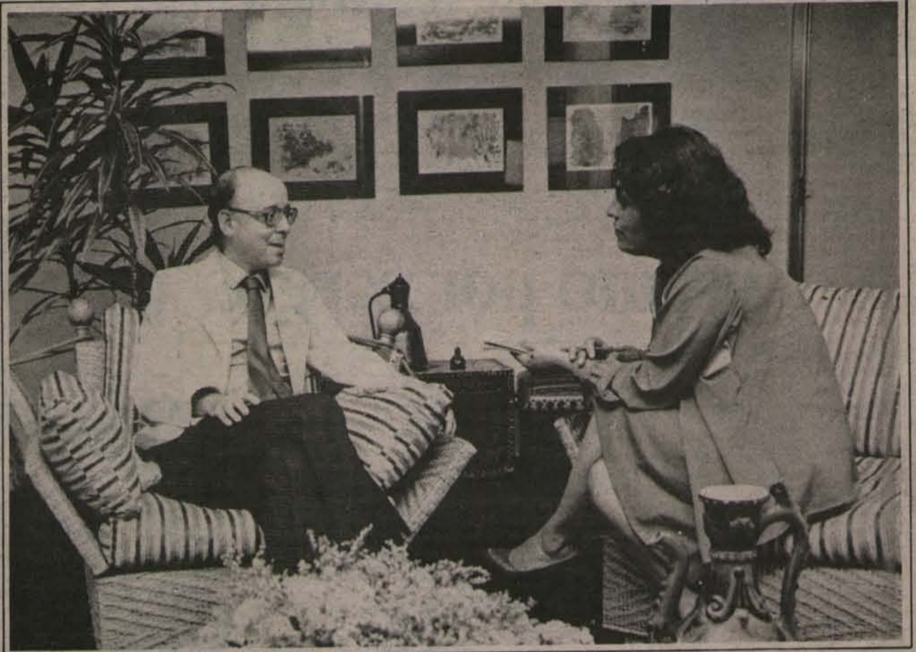
"Los actuales miembros de la mesa directiva estamos en condiciones de abordar la solución para RN".

"No basta poner el cargo a disposición de nadie. Lo que he planteado es que haya una renuncia efectiva de la mesa, sin que se plantee frente a un organismo que deba aceptarla o rechazarla. He planteado la idea de una renuncia colectiva de toda la mesa, en la cual me incluyo, con el objeto de dar paso a una fórmula que permita