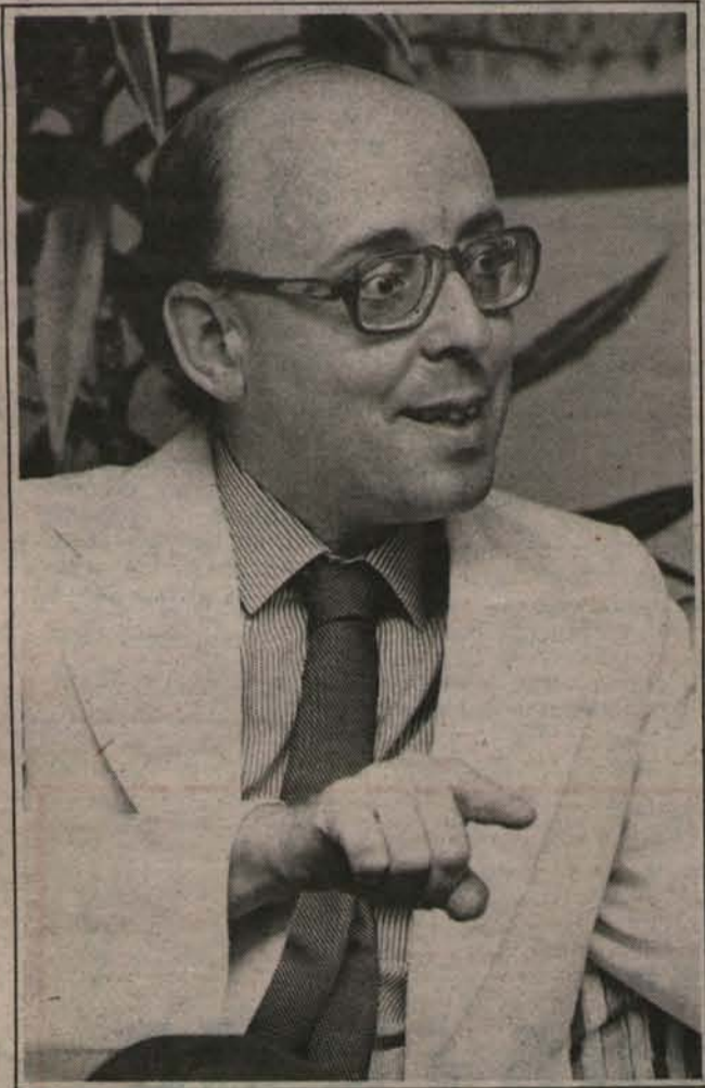
"Creo que el Presidente quiere un partido eficazmente comprometido con el sí".

"Pienso que él desea un partido resuelto y eficazmente comprometido con el "sí".