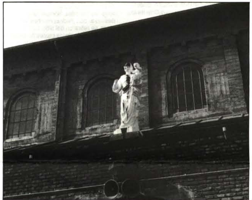
De las manifestaciones ha salido dañado algo más que algunas instalaciones de la Universidad.

Posteriormente, aparecerían en libertad los desaparecidos, mientras Carabineros informaba que personal de la Cuarta Comisaría había detenido a los otros dos