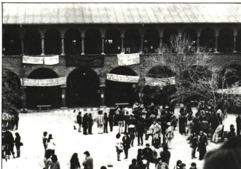
El día de la "Asamblea Popular" obreros detienen la actividad universitaria, el "pop power" en gloria y majestad.