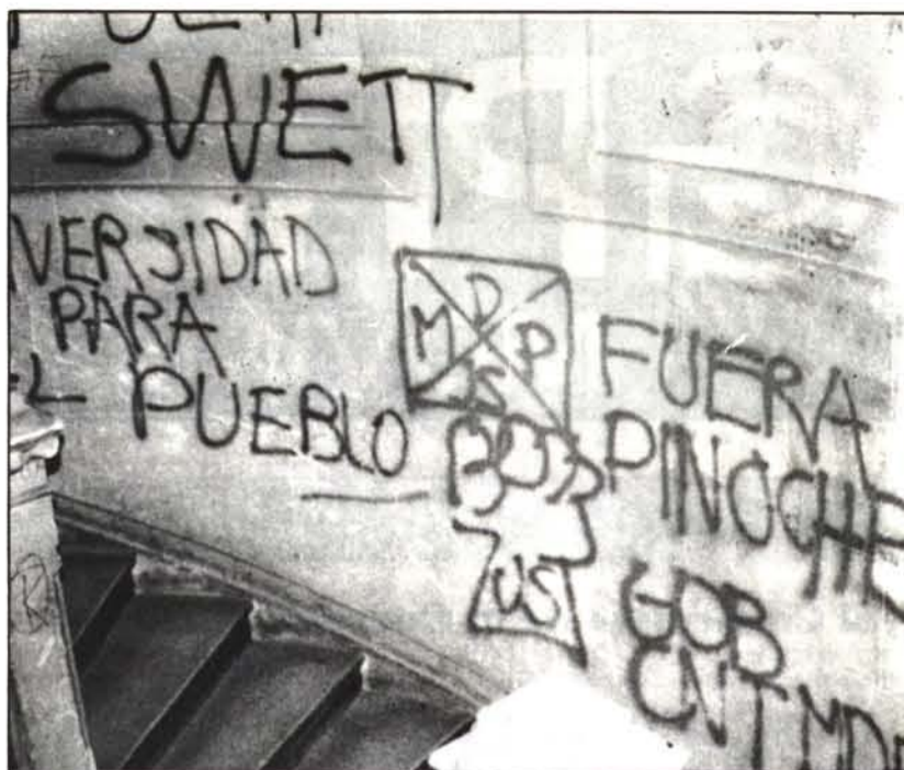
La expresión verbal y los argumentos quedaron siempre descartados.

Por algún motivo, la Coordinadora no reconoció que el "mono" simbolizaba la persona del rector de la Universidad Católica. Seguramente se trataba de una nueva forma de fomentar el diálogo y la convivencia.