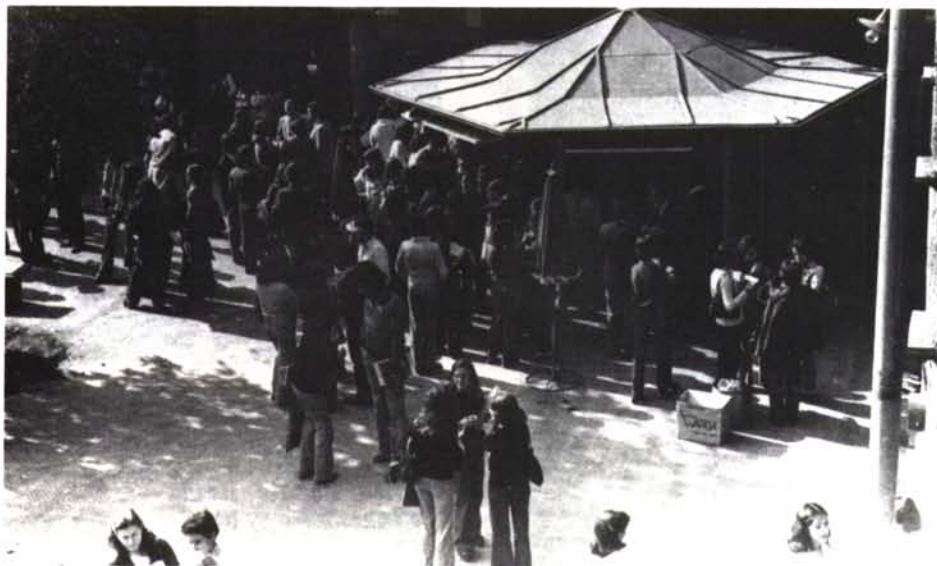
Quiosco: es el punto de reunión de los alumnos del Campus Oriente.