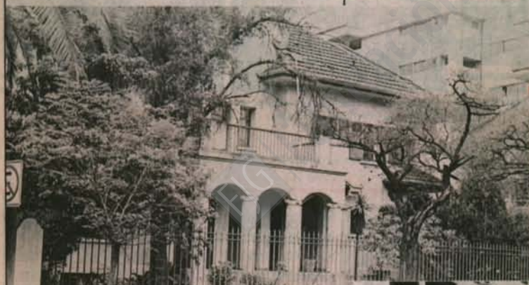
Suecia 286, su casa, ex sede de los gremialistas. La otra, en calle Livingston, está destinada a los pobladores.