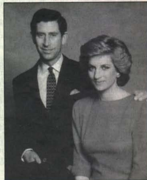
Carlos y Diana de Gales.

Seis jóvenes plebeyas llegaron al altar en la década de los 80. Algunas de ellas con príncipes casi encantados. Otras han sufrido desilusiones. Pero en general sus bodas han impactado a la opinión mundial que ha seguido como si se tratara de un cuento de hadas el curso de los romances. Desde la adolescente que se casó con el hijo del sha de Irán hasta la princesa Diana, que espera pacientemente que su esposo, Carlos, sea rey de Inglaterra, todas han tenido sueños imperiales.