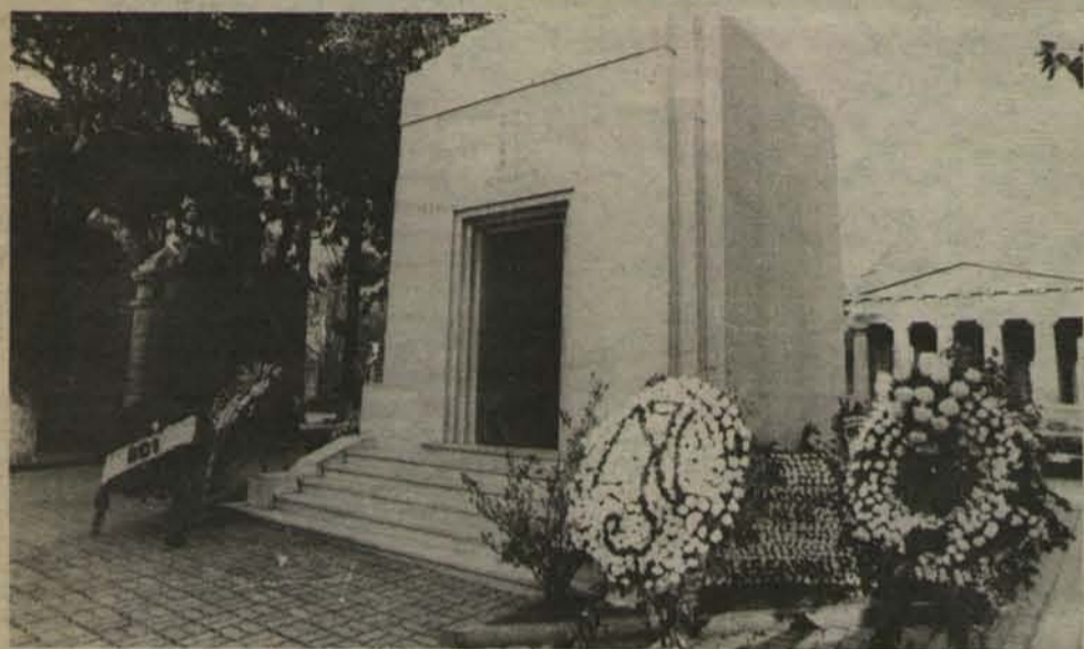
Decenas de coronas rodean el mausoleo familiar.