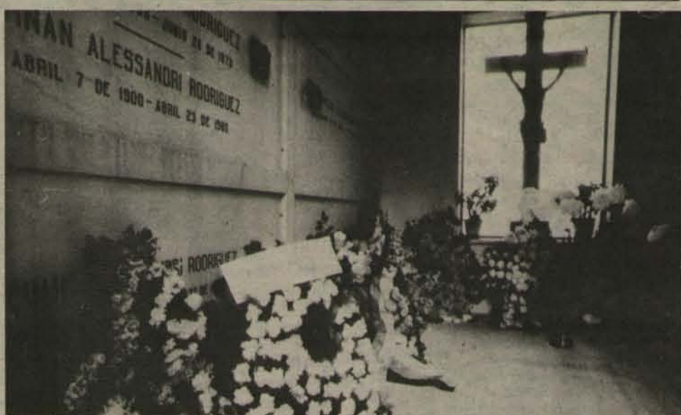
Aún no se ha grabado su nombre en la cripta.