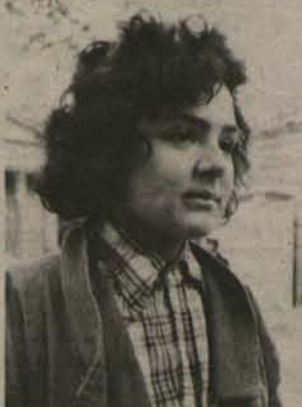
Claudia sabe de sus grandes virtudes.

Algunos empresarios, especialmente en las zonas limítrofes, tienen real interés en lograr la integración. Y se han superado dificultades como las que encontraba la exportación de porotos negros a través de Antofagasta.