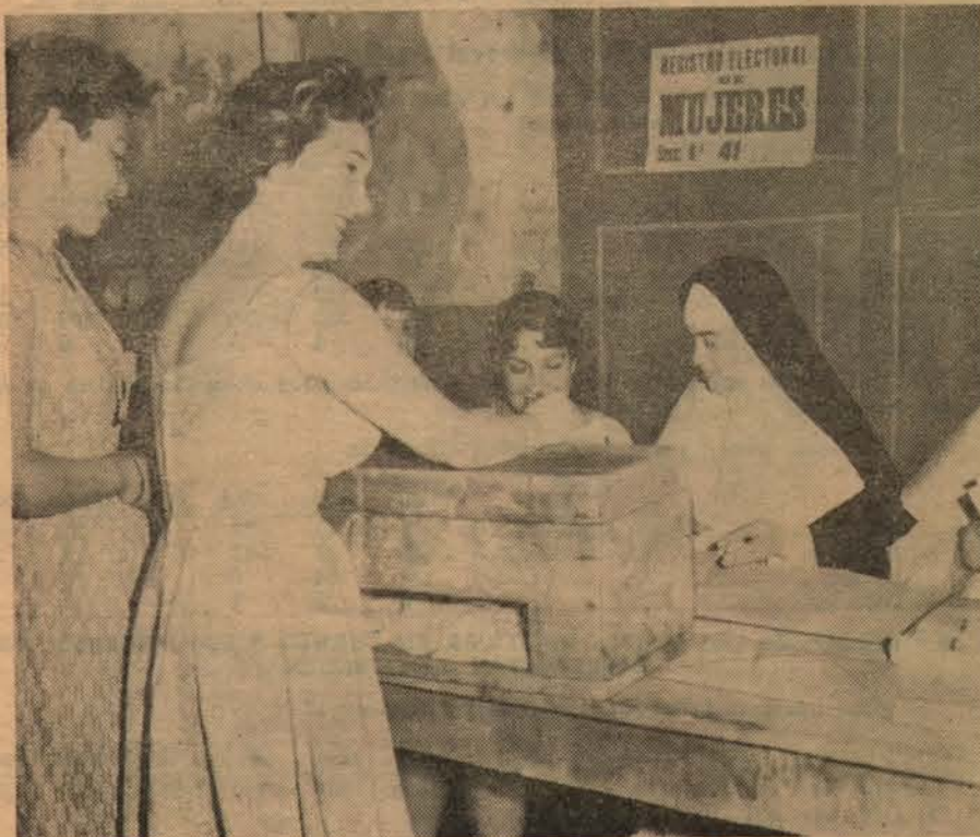
■ EL VOTO.— Expresión democrática del pensamiento ciudadano. La mujer, como de costumbre, será factor esencial en los resultados.