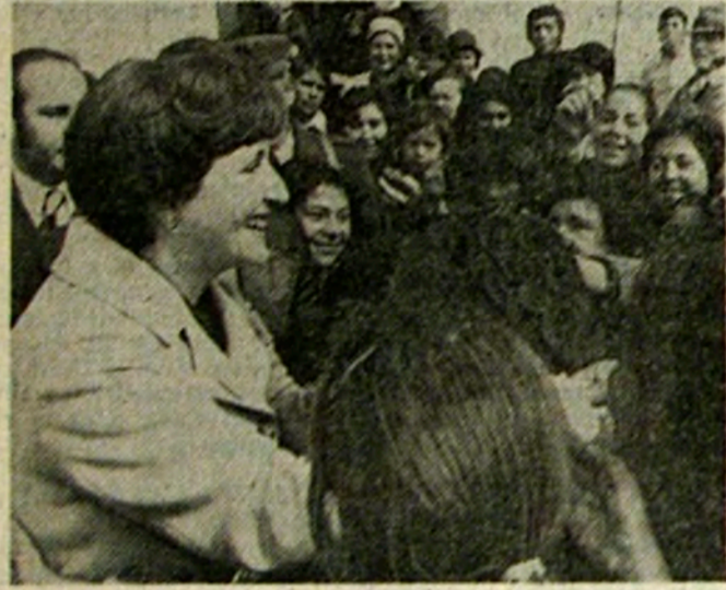
LA SERENA.— Diversas actividades ha cumplido la Primera Dama de la nación, señora Lucía Hiriart de Pinochet, en la Tercera y Cuarta regiones. En la fotografía es entusiastamente recibida por representantes de las organizaciones femeninas de la Cuarta Región.