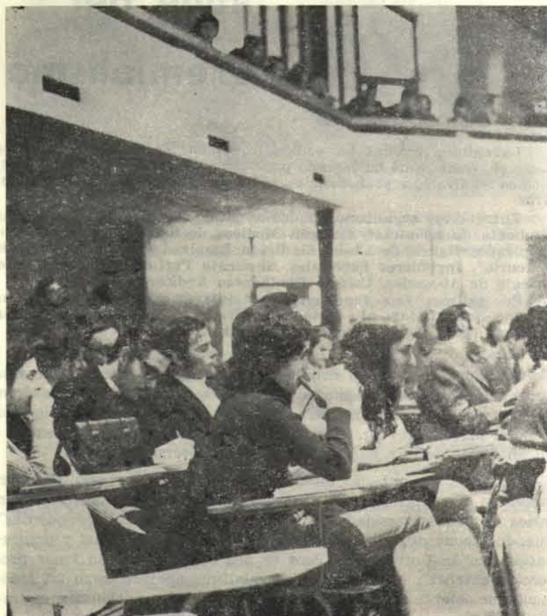
Un aspecto del Claustro. Vemos a un grupo de representantes estudiantiles siguiendo los debates.

Por fin, fue posible aprobar un esquema de gobierno central de la Universidad, que entregue la función legislativa, ésto es, el poder de decisión de la vida universitaria, a cuerpos verdaderamente representativos, elegidos a lo menos en el 75 por ciento de sus miembros por votación directa y general de toda la comunidad Universitaria. Especial relieve alcanza el nuevo esquema respecto de Vicerrectoría de Comunicaciones y de Canal 13, cuya reorganización acordada por el Claustro explícitamente, tuvo el declarado sentido