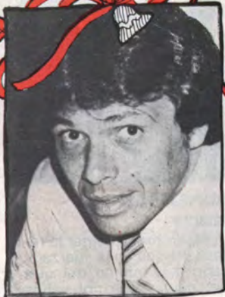
ELIAS FIGUEROA, integrante de la Selección Nacional de Fútbol.