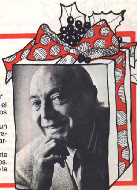
FELIPE RABAT, empresario y actor