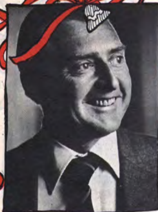
PATRICIO GUZMAN, Alcalde de Santiago