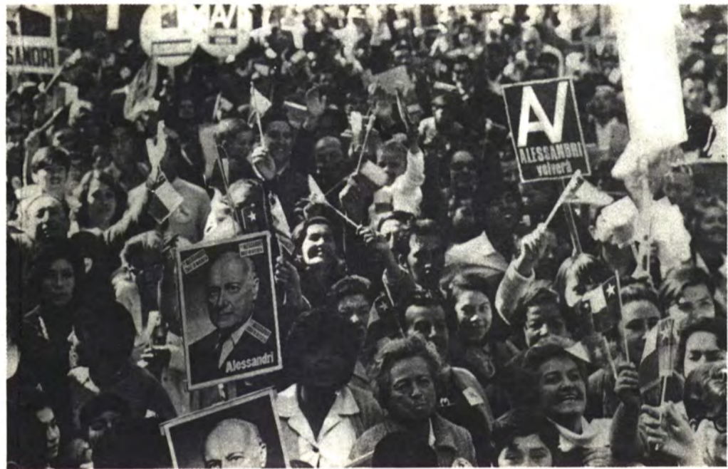
VICUÑA: ¡Alessandri! ¡Alessandri!