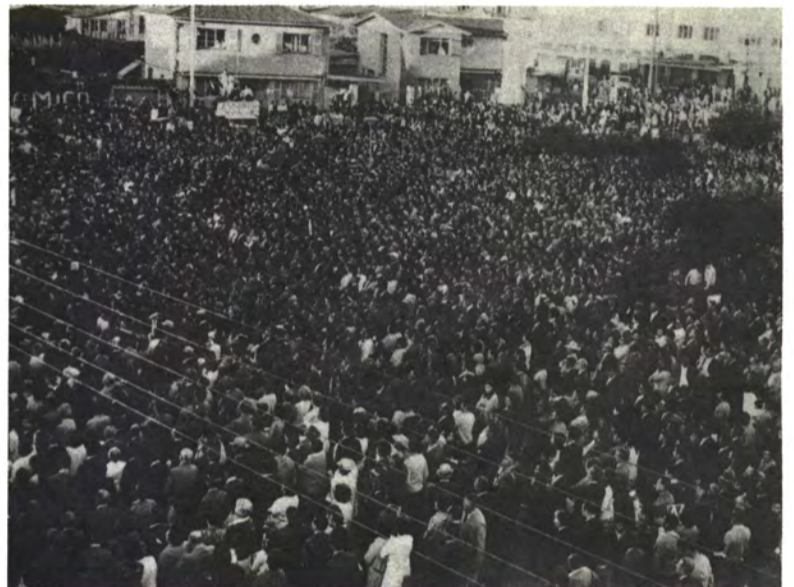
OSORNO: ¿Se necesita decir algo?