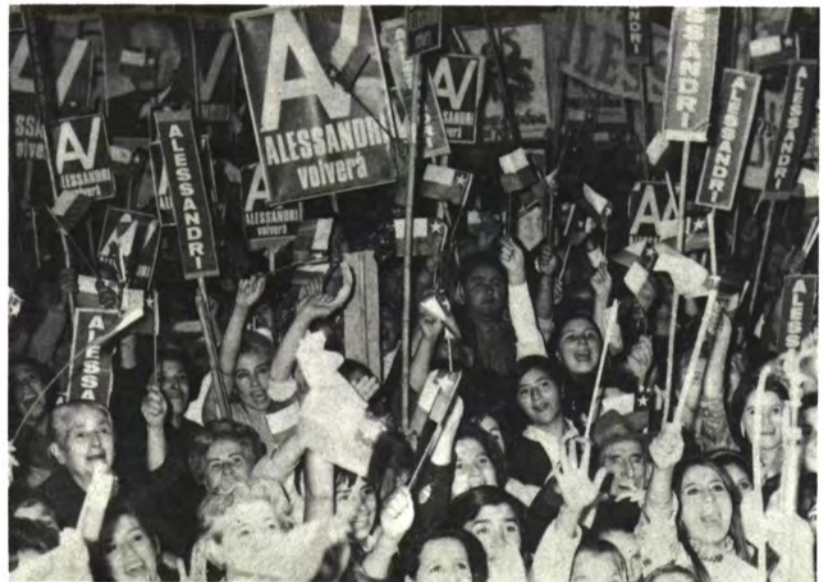
CHILLAN: Algo nunca visto allí.