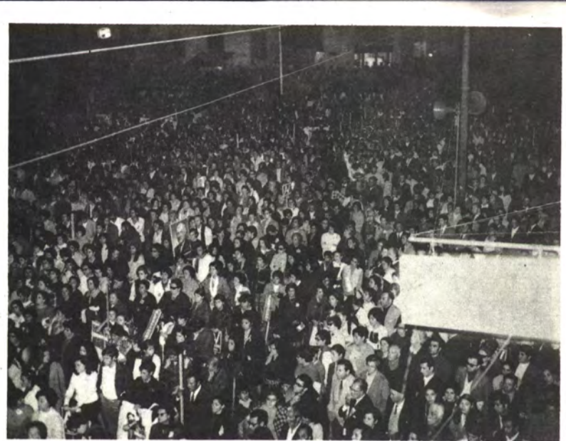
TALCA: Esta es solo parte del público.