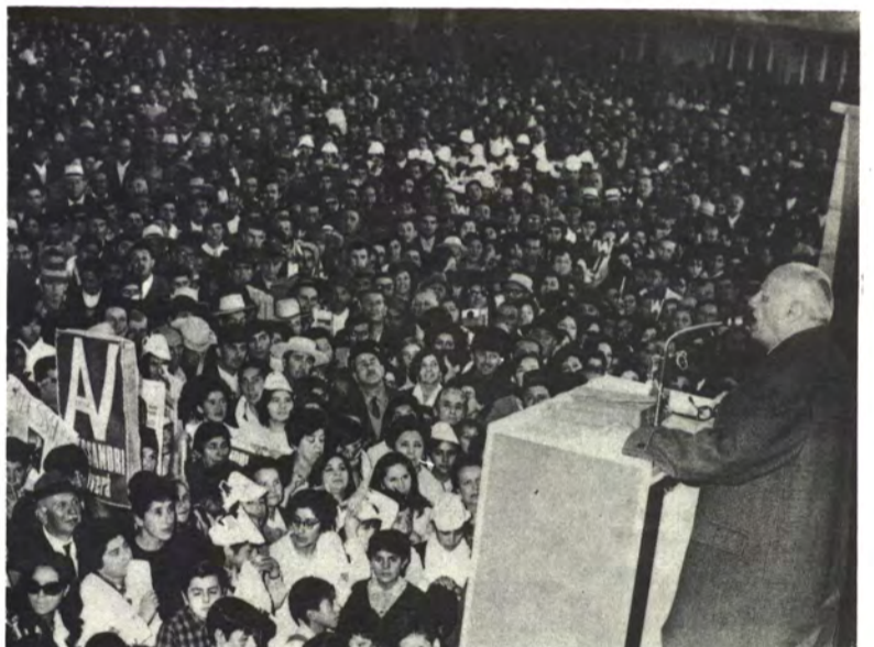
LOS ANGELES: Bio Bio, territorio alessandrista.