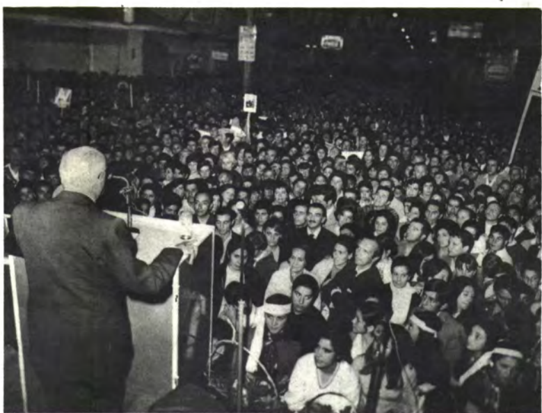
RANCAGUA: Muchedumbre desbordó la Plaza