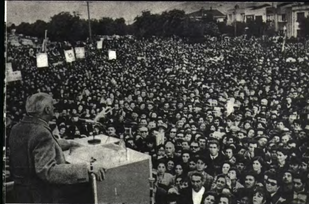
TEMUCO: La primera jira.