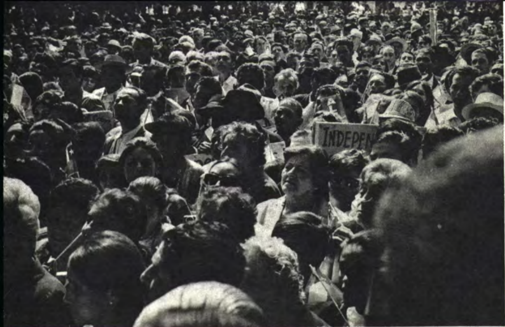
SAN JAVIER: ¡Alessandri y nadie más!