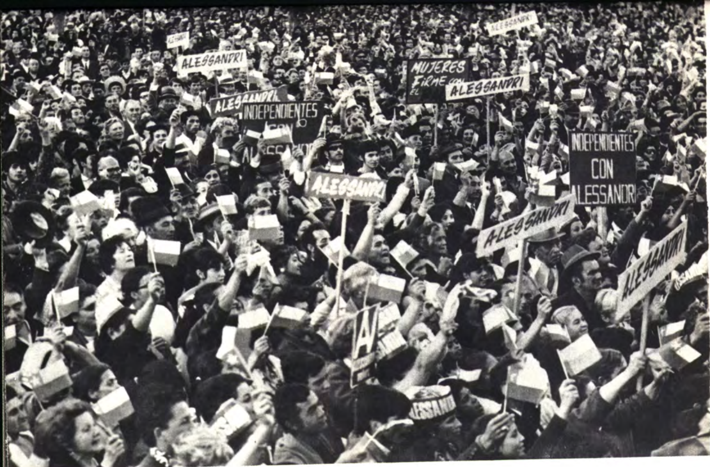
VALDIVIA: Era comuna socialista, decían.