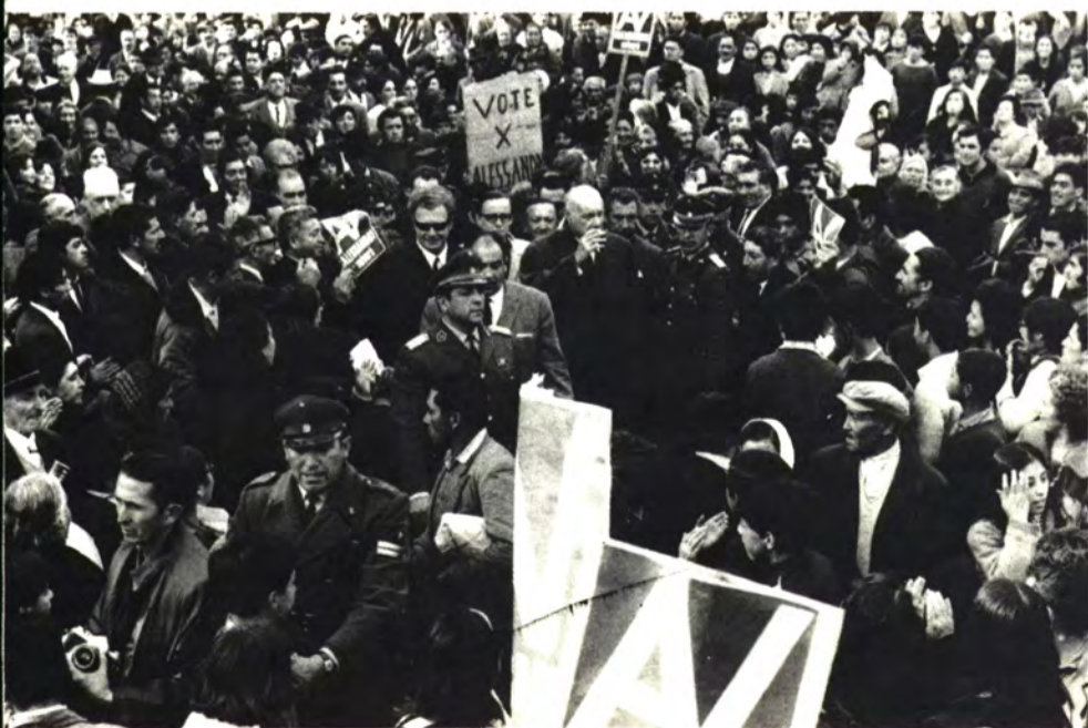
CASTRO: Esta fue sólo la llegada