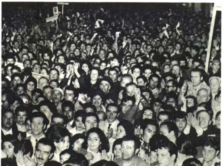
SAN FERNANDO: Rivalizó con Santa Cruz.