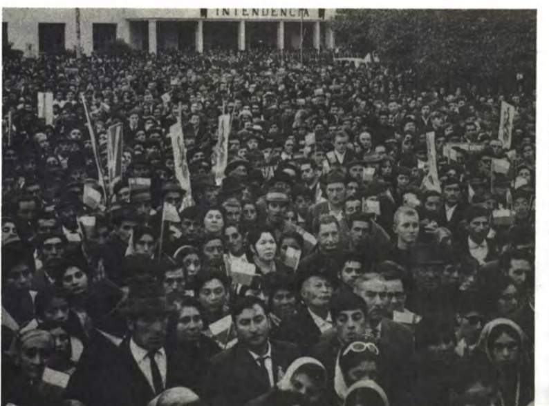
PUERTO MONTT: Llanquihue proclamó su voluntad.