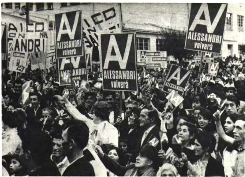
ANGOL: Firmes con el Paleta.