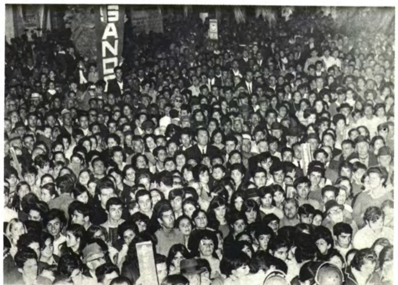
ILLAPEL: Todavía recuerdan este acto.