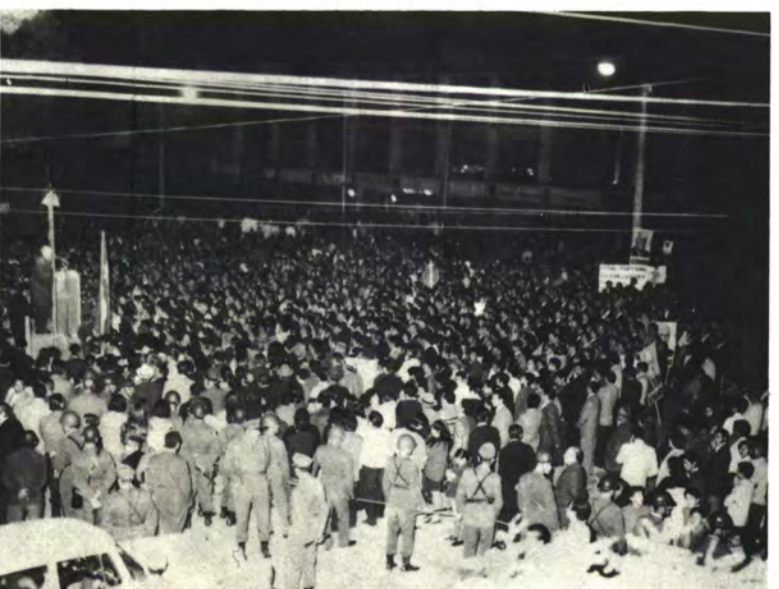
RENGO: Hasta con fuegos artificiales.