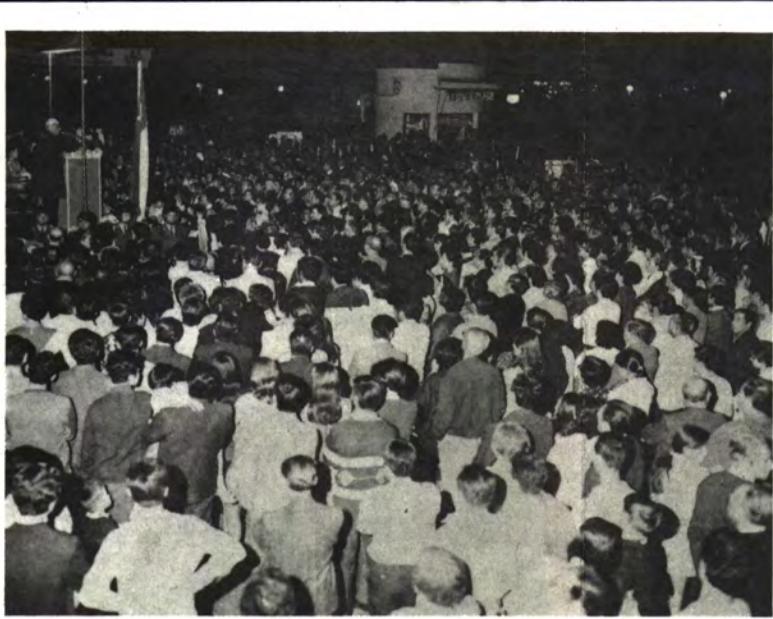
SAN FELIPE: Huelgan los comentarios.