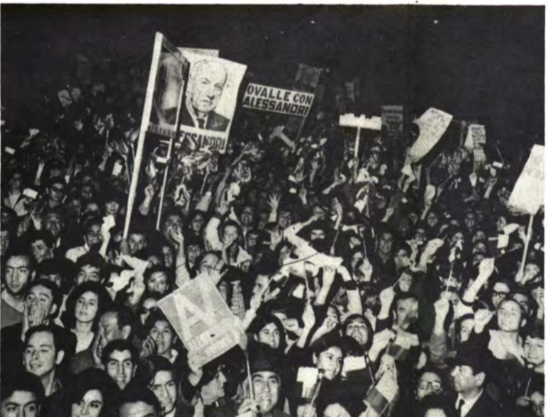
OVALLE: Por si faltaran argumentos.