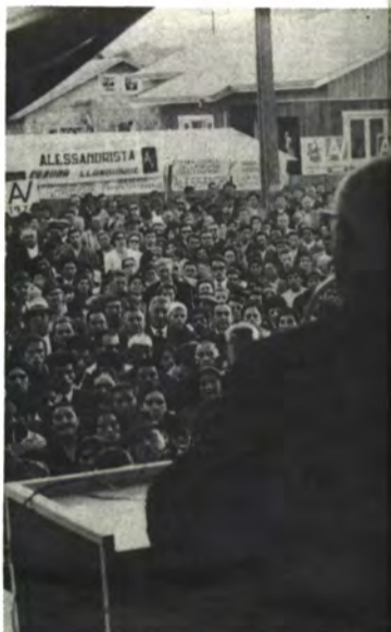
PUERTO VARAS: El alessandrista