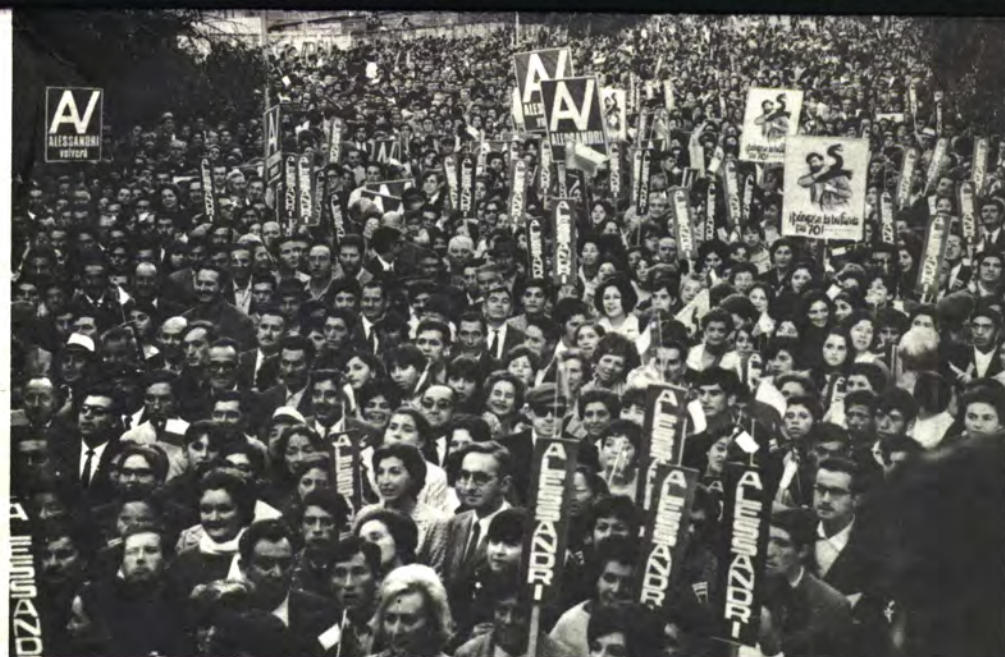
CONCEPCION: Respuesta a la violencia.