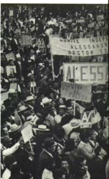
CAUQUENES: Maule da su mayoría