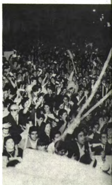
CURICO: Nada más que hablar.