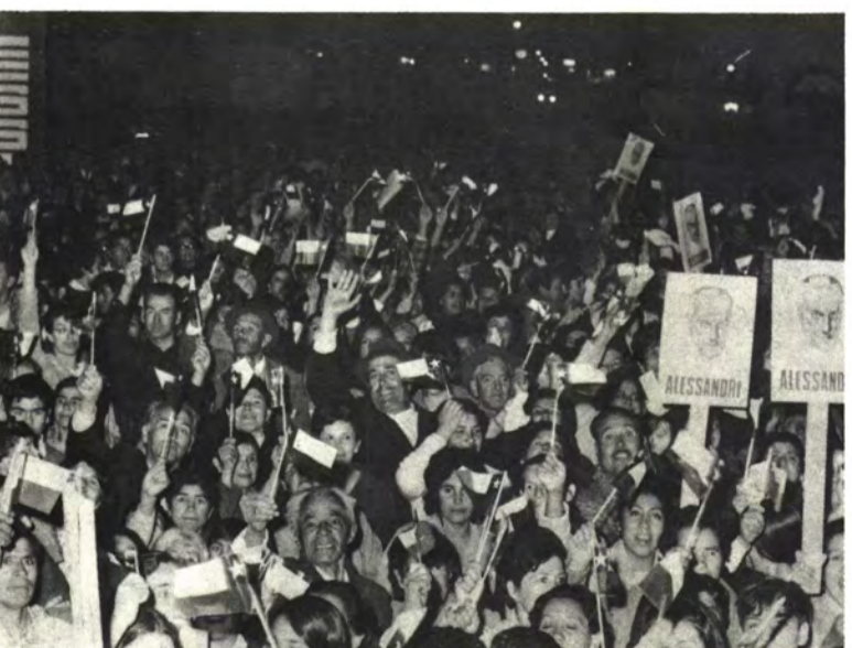
VALLENAR: El fervor atacameño.