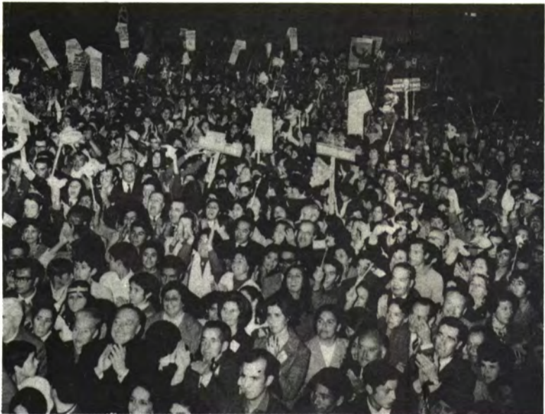
LA SERENA: Confirmó la victoria en el Norte.