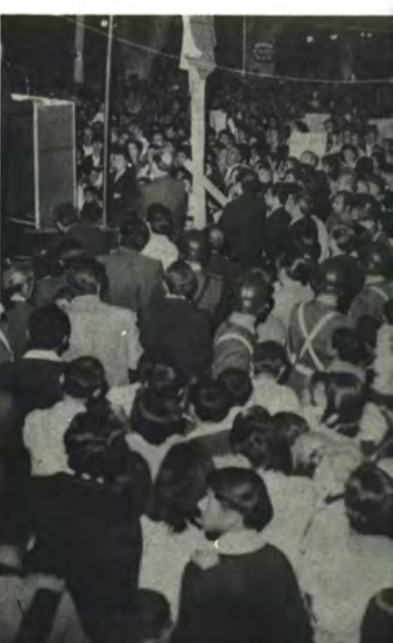
LOS ANDES: La Plaza a reventar.