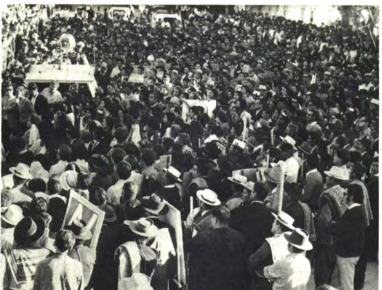
MARCHIGÜE: Jamás conoció algo igual.