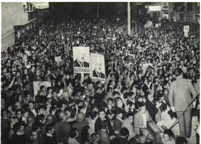
SANTA CRUZ: Faltó espacio.