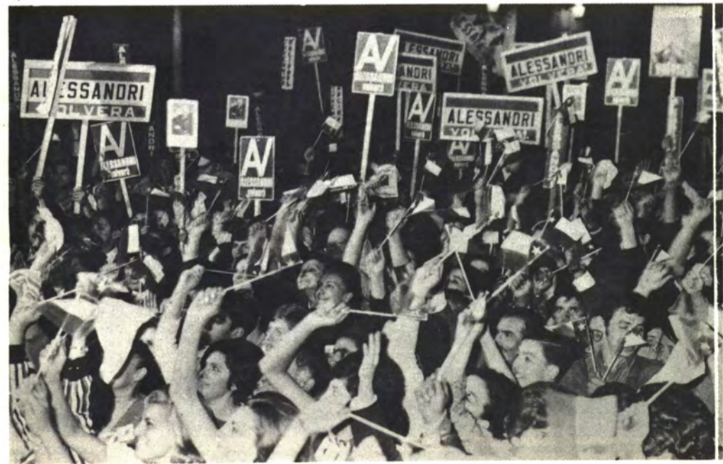
LINARES: Entusiasmo arrollador.