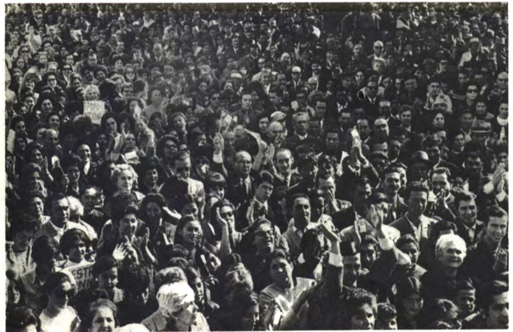
MOLINA: Todas las edades y clases sociales.