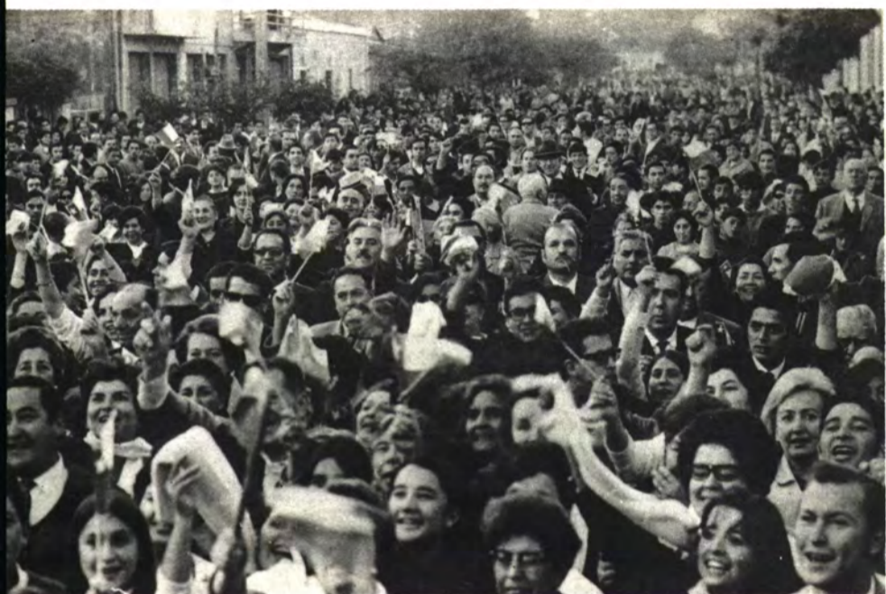
TALCAHUANO: El puerto gritó: ¡Volverá!