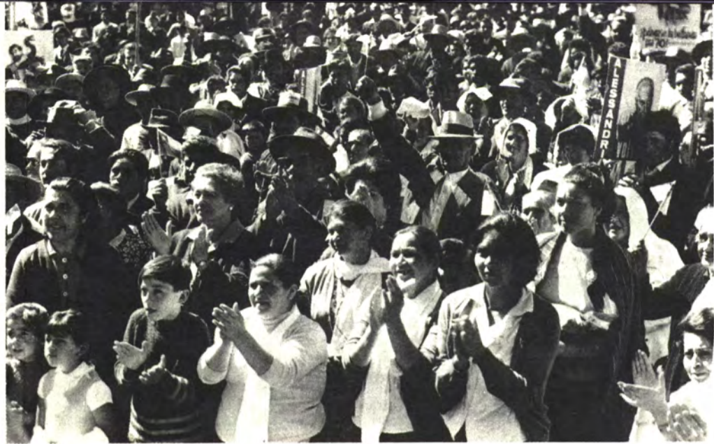
YUNGAY: Aplausos campesinos.