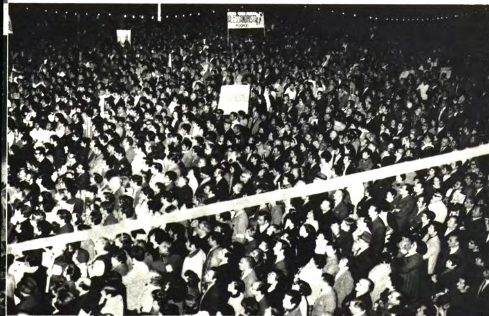
VALPARAISO: El Almendral se despoblo.