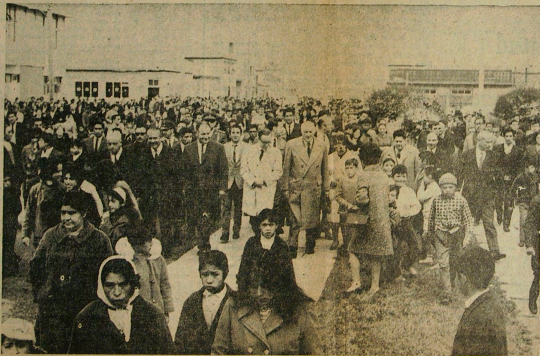
ENTUSIASMO INDESCRIBIBLE.— El candidato independiente a la Presidencia de la República, don Jorge Alessandri Rodríguez, llega a la Plaza de Puerto Natales, donde se le tributó un extraordinario recibimiento, tal como se observa en la fotografía. Hasta el momento, la gira de don Jorge Alessandri por las provincias del extremo sur ha sido un anticipo de su triunfo arrollador el día 4 de septiembre de 1970.