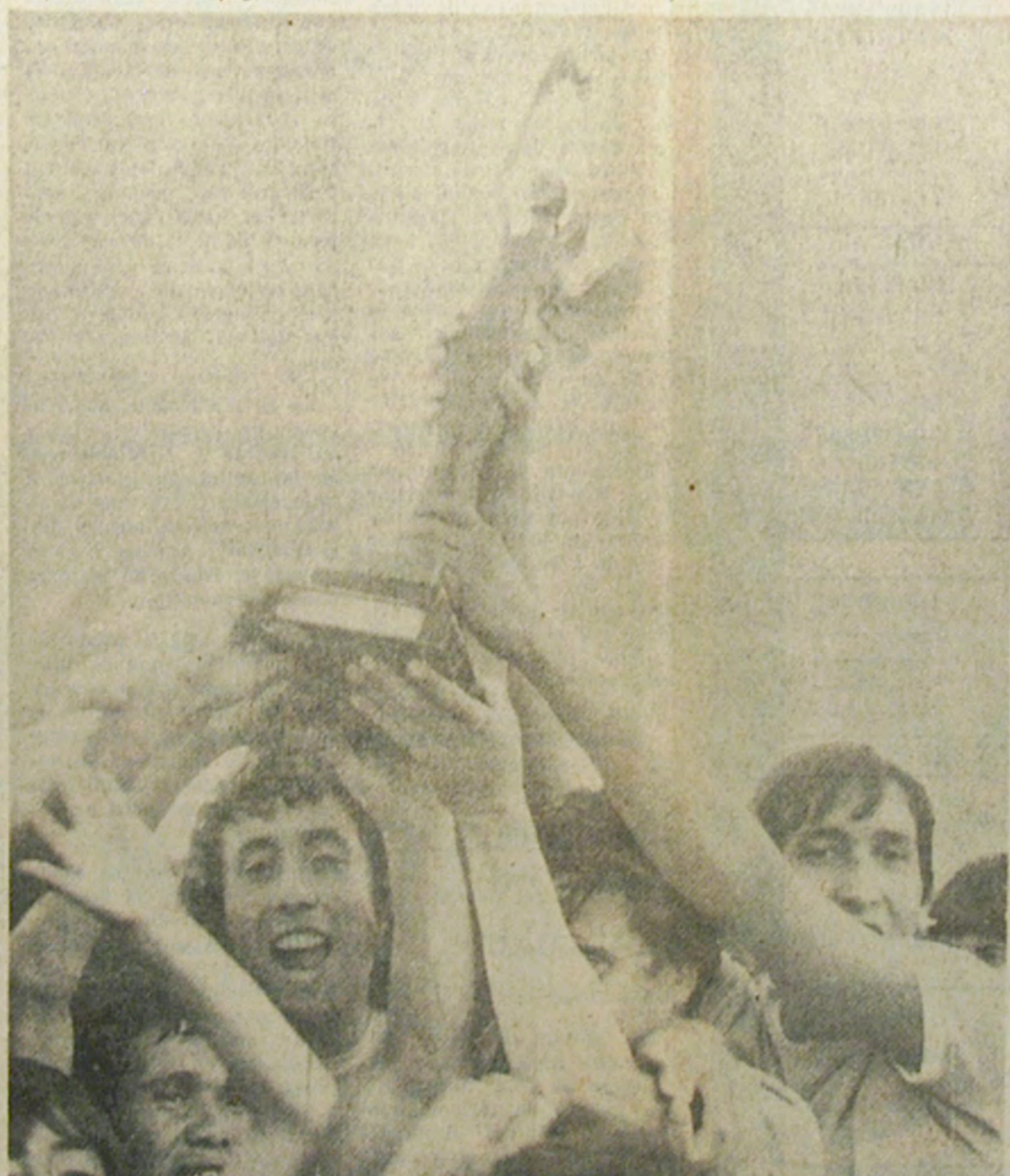
TROFEO DEL SUBCAMPEON.— El trofeo que entregó la Asociación Central al equipo ovalino por haber logrado el subcampeonato de Ascenso, y en consecuencia subir a Primera División, es levantado por los jugadores. Alegría inmensa vivieron los futbolistas luego de su sensacional victoria sobre Linares. (Información en pág. 7)