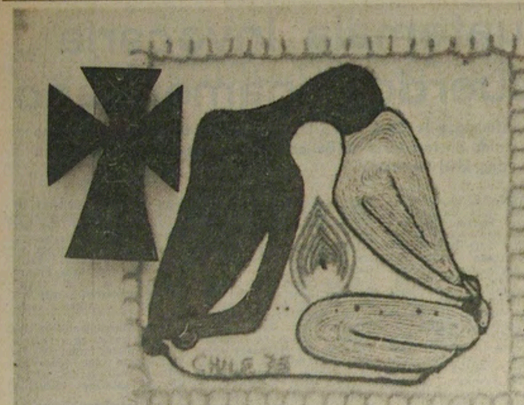
Bordados como el del grabado eran hechos por reclusas del "Buen Pastor" dirigidas por el sacerdote detenido, con el objeto de ser enviados al exterior, a través del Comité Pro Paz. La figura representa a dos personas unidas por la cabeza y que, además, están maniatadas por la espalda y arrolladas. Al centro, una llama, y una lectura: Chile 75.