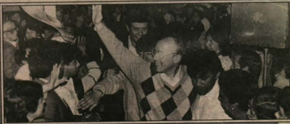
En cada una de sus presentaciones públicas, Jaime Guzmán recoge los anhelos de los chilenos. La inmensa mayoría le otorga su reconocimiento por la permanente colaboración que prestó al Gobierno del Presidente Pinochet.