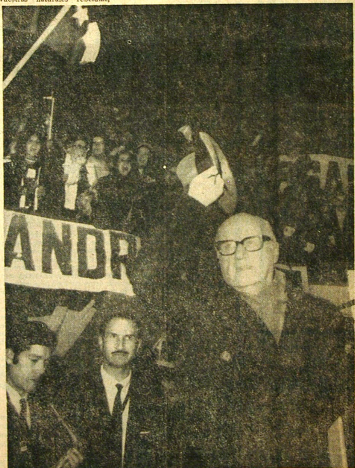
Alessandri saluda a los miles de jóvenes, al llegar al teatro Caupolicán

En comunicaciones de las Candidaturas de la realización y manejo Joven" y "Acción Muj Declaramos que nada creación, ejecución o d Como comprobación a consultar a los medic una confirmación a la