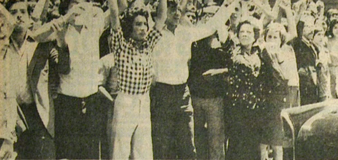
Cerca de las dos de la tarde, finalizada la ceremonia religiosa, grupos de devotos exteriorizaban así sus gritos de adhesión al Cardenal

Carabineros que se hallaban apostados en el sector de la Plaza de Armas dispersaron a los manifestantes. El incidente ocurrió poco antes de las 14 horas, vale decir, después de terminada la ceremonia en la iglesia, que duró justamente hora y media.