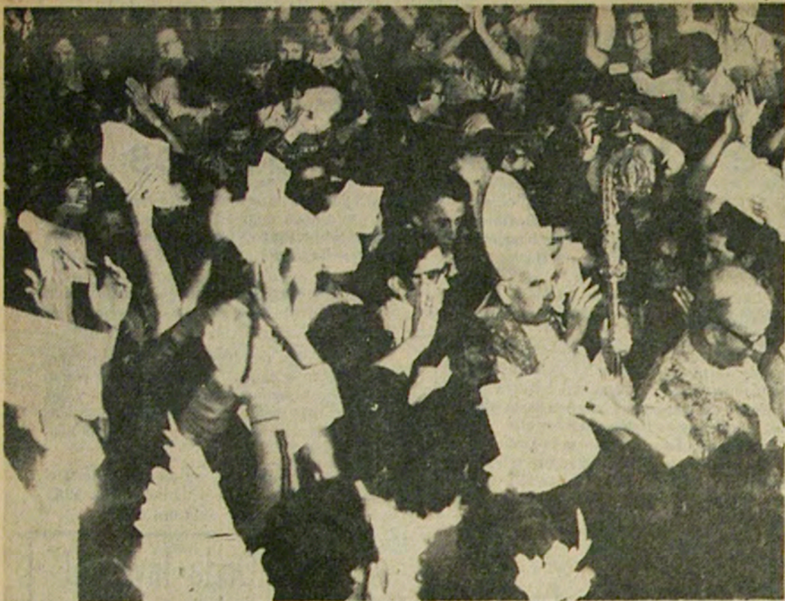
Así fue el ingreso del Cardenal hasta el Altar Mayor, en medio de manifestaciones inusuales en el interior de un templo

En todos los templos se verificó una concurrencia extraordinaria de fieles y cientos de niños, como es tradicional, recibieron por primera vez la Sagrada Comunión en este día.