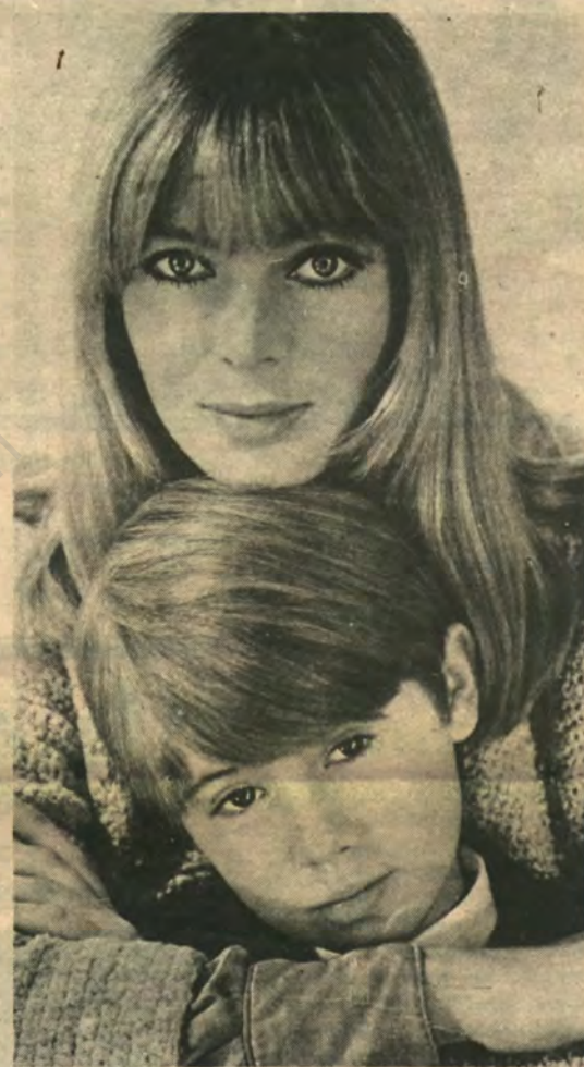
La mujer piensa diferente al hombre. Es mucho más realista y no vive de ilusiones.

“Muy pocas en Chile. Sólo cuando tienen dificultades acuden al hospital para su investigación. Yo diría que no hay que caer en el abuso que se ha hecho en Estados Unidos, donde todos los alumnos saben, al igual que su apellido, la calificación que tienen en las pruebas mencionadas. Eso puede causar daños enormes a determinadas personas, y pienso que sólo son necesarias en casos de extrema necesidad”.