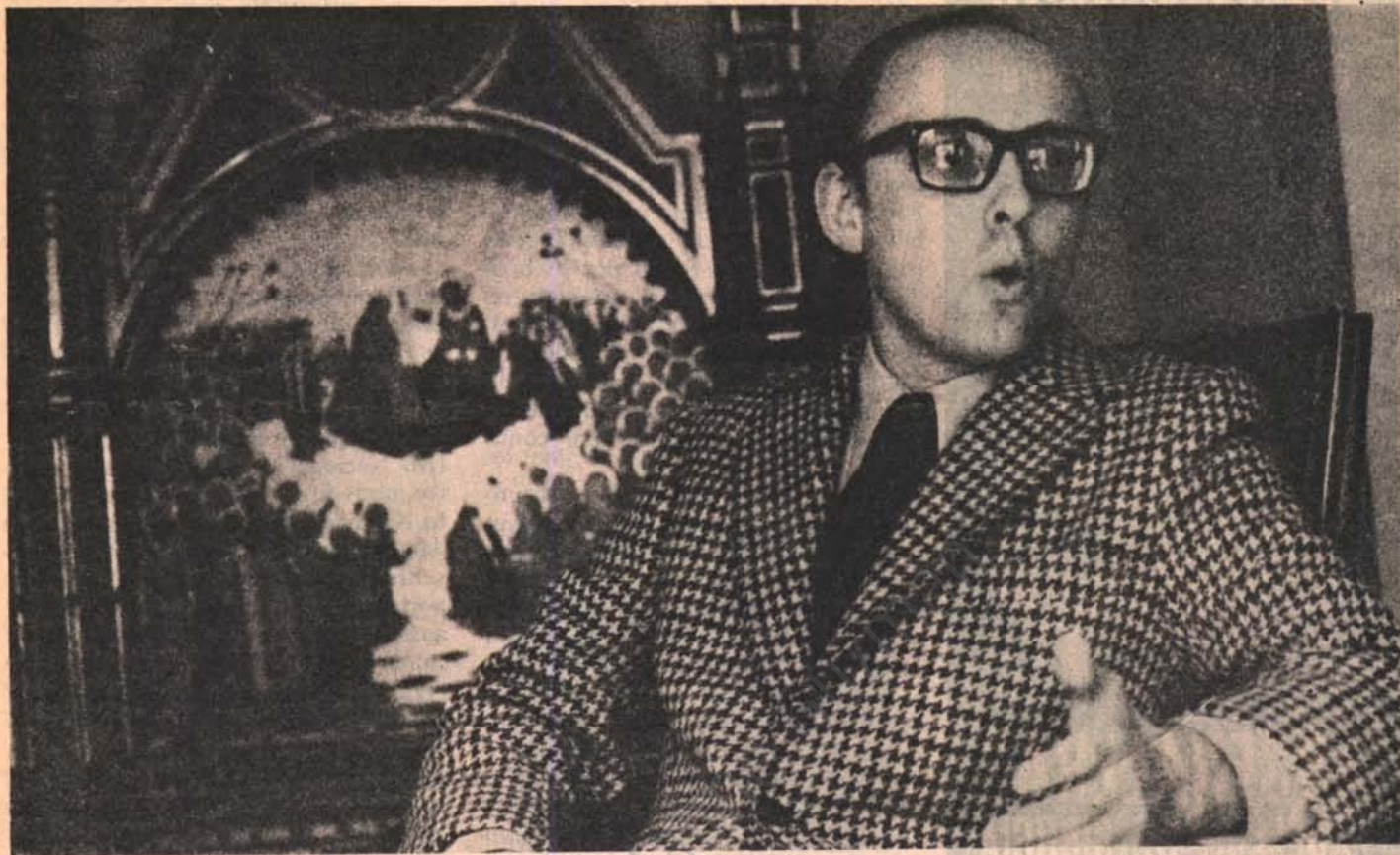
RETORNO A LA DEMOCRACIA "CUANDO LA FRUTA ESTE MADURA" "Ni tan temprano que esté verde, ni tan tarde que pueda podrirse"