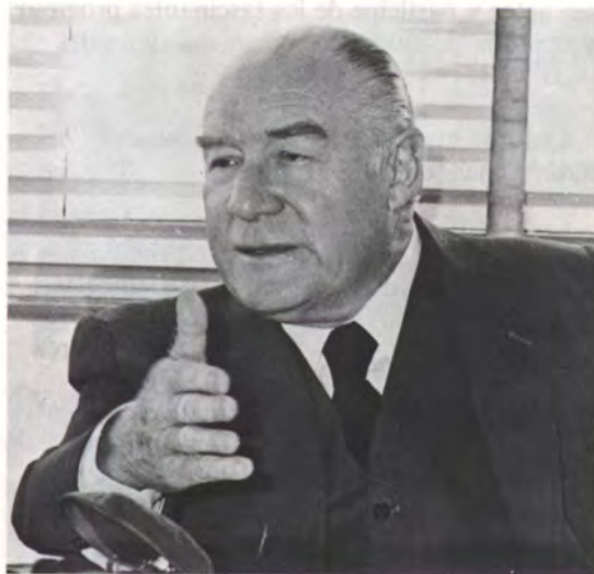
Sergio O. Jarpa

tativa; Economía Social de Mercado, fundada en la armonía social, la empresa privada y el derecho de propiedad; acción concreta en favor de los más pobres; rol subsidiario del Estado; fortalecimiento de las organizaciones intermedias de la sociedad; oposición resuelta al comunismo y a toda forma de totalitarismo y de violencia; conformar una alternativa política independiente y con identidad propia que contribuya a dar estabilidad al país.