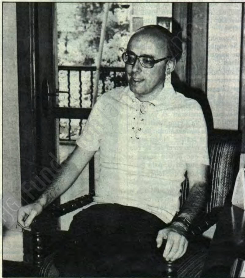
▲ "La UDI es el movimiento político que estuvo, está y se siente más cerca de don Jorge", dijo Jaime Guzmán a "Cosas".

Habla pausadamente frente a la grabadora, pensando una y otra vez la palabra exacta antes de decirla. Es analítico, racional, alguien podría pensar que hasta frío en sus razonamientos. El dice que es porque ha logrado "un suficiente distanciamiento interior de lo que es el mundo político y sus pasiones, interesándome participar en él sin ser sedu-