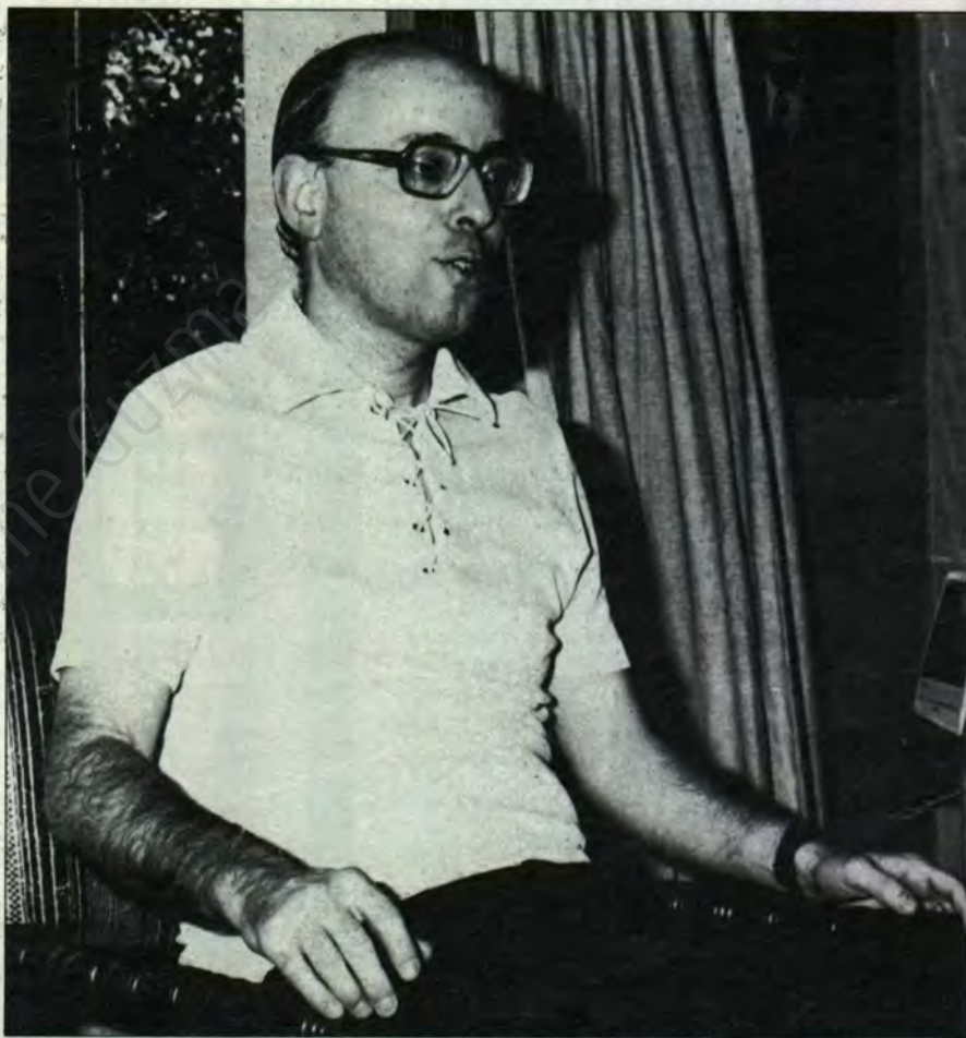
▲ “Queremos contribuir protagónicamente a que los comandantes en jefe acierten en la determinación del candidato presidencial para 1989”.

—Pensamos que el plebiscito es mejor, porque favorece en mayor