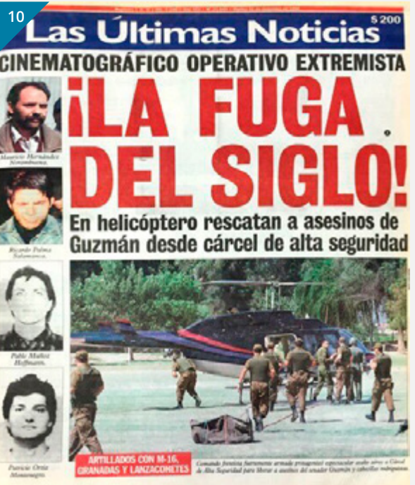
Foto 7: Enero 1994, La Segunda destaca que familia de Guzmán pidió no aplicar pena de muerte para los autores materiales del asesinato del senador. Foto 8: Diciembre 1996, El Mercurio titula sobre la fuga de los asesinos de Jaime Guzmán. En total 4 extremistas escaparon en un helicóptero Bell, el cual dejó caer una cuerda de 15 metros con un canastillo. Foto 9: Diciembre 1996, "El Gran Escape", fue el titular de La Tercera de la época sobre la huida de los autores materiales del asesinato a Jaime Guzmán. Foto 10: Diciembre 1996, "La fuga del Siglo" tituló el matutino Las Últimas Noticias destacando el carácter "cinematográfico" del operativo.