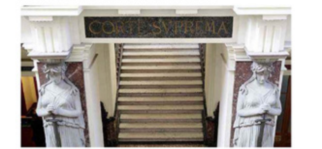
El acusado del asesinato de Jaime Guzmán y del secuestro de Cristián Edwards, se encontraba sujeto a firma diaria y arraigo por orden de la autoridad judicial en Francia.

(1)TTTPWVWVWELMAGOTRACADUALIATOWELMOTRANOD | 26 febrero 2018