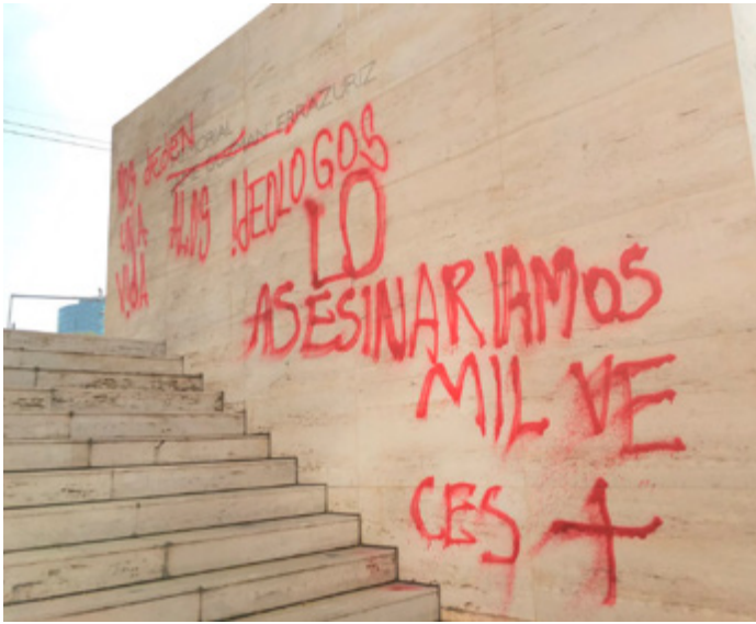
Imagen: "Nos deben una vida a los ideólogos, lo asesinaríamos mil veces más"