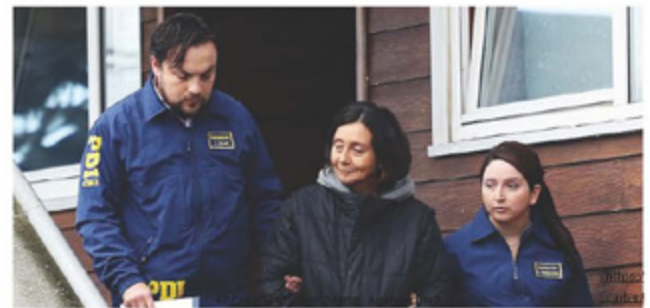
Foto 15: Noviembre 2015. Se formaliza solicitud de extradición de "Comandante Ana" ante Cancillería india.