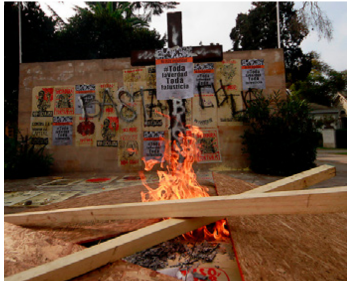
Imagen: Tumba Jaime Guzmán Errázuriz

Por sus ideas. Lo mataron sin que él, en su vida, hubiera empuñado un arma o usado la violencia como instrumento de acción política. Él fue un signo de contradicción para su época. La firmeza, inteligencia y lealtad con la que defendió sus ideas causaban fastidio e incluso rencor en sus adversarios. Pero, a pesar de que sabía esto y de que recibió múltiples amenazas, nunca cedió a la tentación de callar para evitar algún mal. Su valentía asombraba a todos. En él existía la convicción de que la vida sólo valía la pena vivirla por altos ideales y que cualquier traición a ellos era peor que la muerte. Era esa certeza y la seguridad de defender nobles principios morales lo que convirtió su sacrificio en martirio.