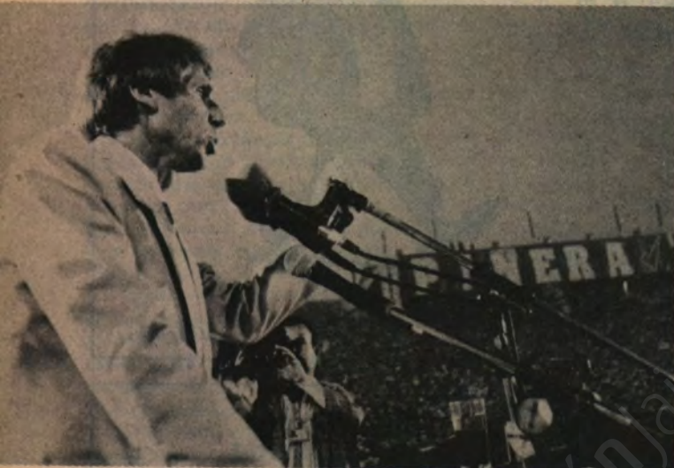
Hernán Büchi: en plena acción.

□ En materia parlamentaria se dibujan los bloques internos de la Concertación y otra vez aparece la "Alianza Chica" luchando contra la izquierda.