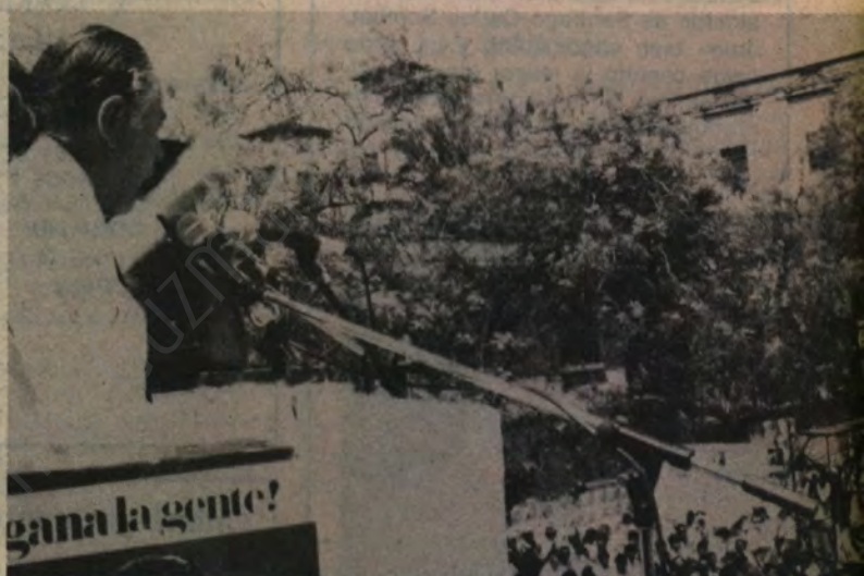
Patricio Aylwin: viajó a la séptima región.

A menos de dos meses de las elecciones generales de Presidente de la República y de congresales, el panorama tiende a polarizarse entre dos postulantes: Hernán Büchi y Patricio Aylwin.