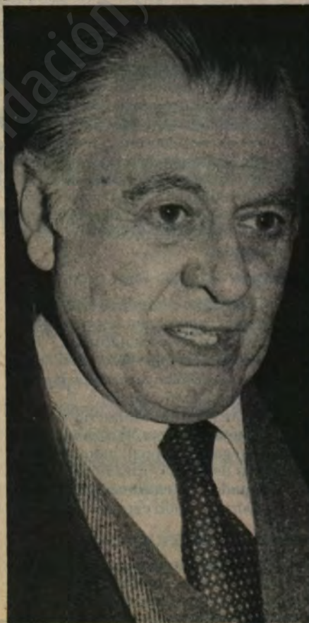
Patricio Aylwin Azócar.