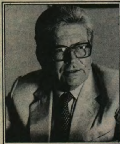
por Arturo Fontaine A.

Contaban los diecisiete concertados con la maestría política de Aylwin, antiguo parlamentario, viejo profesor de derecho, fogueado en los debates partidistas y electorales en sus largos setenta años. A ese Goliat se le oponía un David sin experiencia política y polémica, un ingeniero, un experto en asuntos económicos desprovisto de recursos oratorios