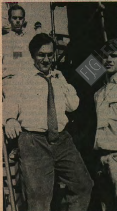
Sebastián Piñera: candidato a senador.

El esquema no resultó, porque aquellos grupos que estuvieron cerca del régimen dieron rienda suelta a sus diferencias, y como siempre habían respaldado al gobierno dando apoyos excluyentes, se llegó a la realidad: hay cinco listas de candidatos de sectores que habían estado o están cerca del régimen. Al revés, la oposición llegó en algunos lugares, por acuerdo expreso a listas paralelas, que no interfieren en una lucha interna.