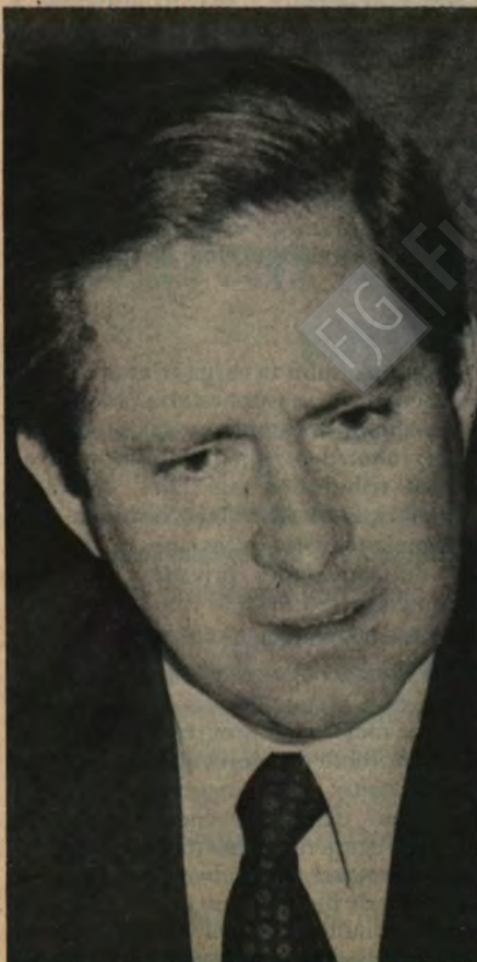
Francisco Javier Errázuriz.

Aylwin: Solucionar problema de la "cartera vencida de los pobres". Corrección del sistema de UF para establecer una mayor sincronización entre reajustes de dividendos y las remuneraciones.