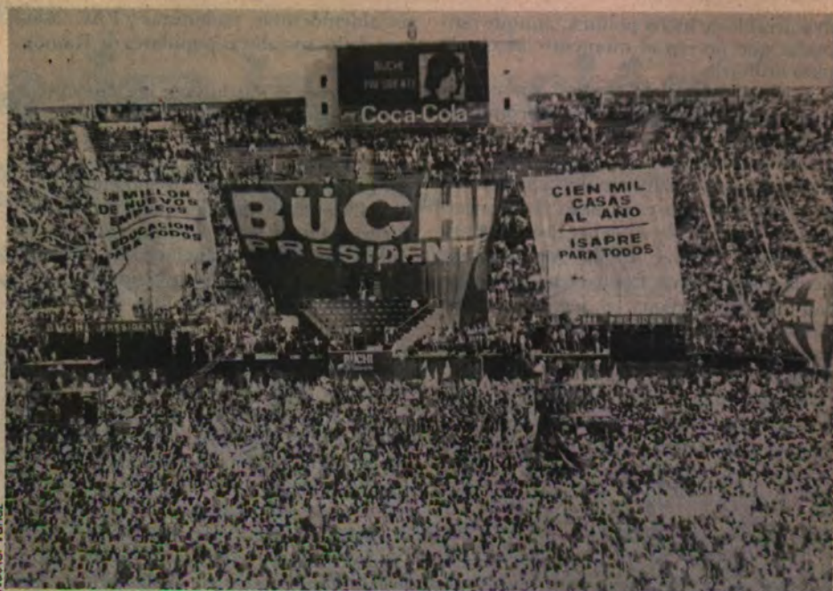
La foto fue captada antes de la llegada de los candidatos a parlamentarios.

En la Alameda destacaron las banderas de los partidos que respaldan a Patricio Aylwin, sobresaliendo los rojos símbolos de la izquierda; en el Estadio Nacional predominaron las banderas azules y blancas, colores que utilizan el propio candidato, Renovación Nacional y la UDI. En la Alameda se colocaron altoparlantes en varias cuerdas para difundir los discursos de los oradores y presenciar la actuación de algunos conocidos conjuntos musicales de tendencia izquierdista. En el Estadio Nacional, equipos de amplificación llevaron a