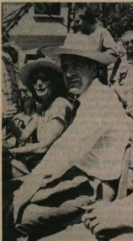
Eduardo Frei R. T.: también postula al Senado.