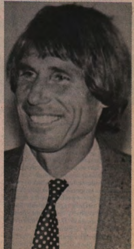
Hernán Büchi Buc.

Programas de prevención y tratamiento de patologías más comunes (enfermedades cardiovasculares y cáncer). Campañas de prevención de enfermedades crónicas, de transmisión sexual, alcoholismo y drogadicción. Mantención de avances en atención materno-infantil. Franquicias tributarias para incentivar donaciones para infraestructura y equipamiento. Ampliación de