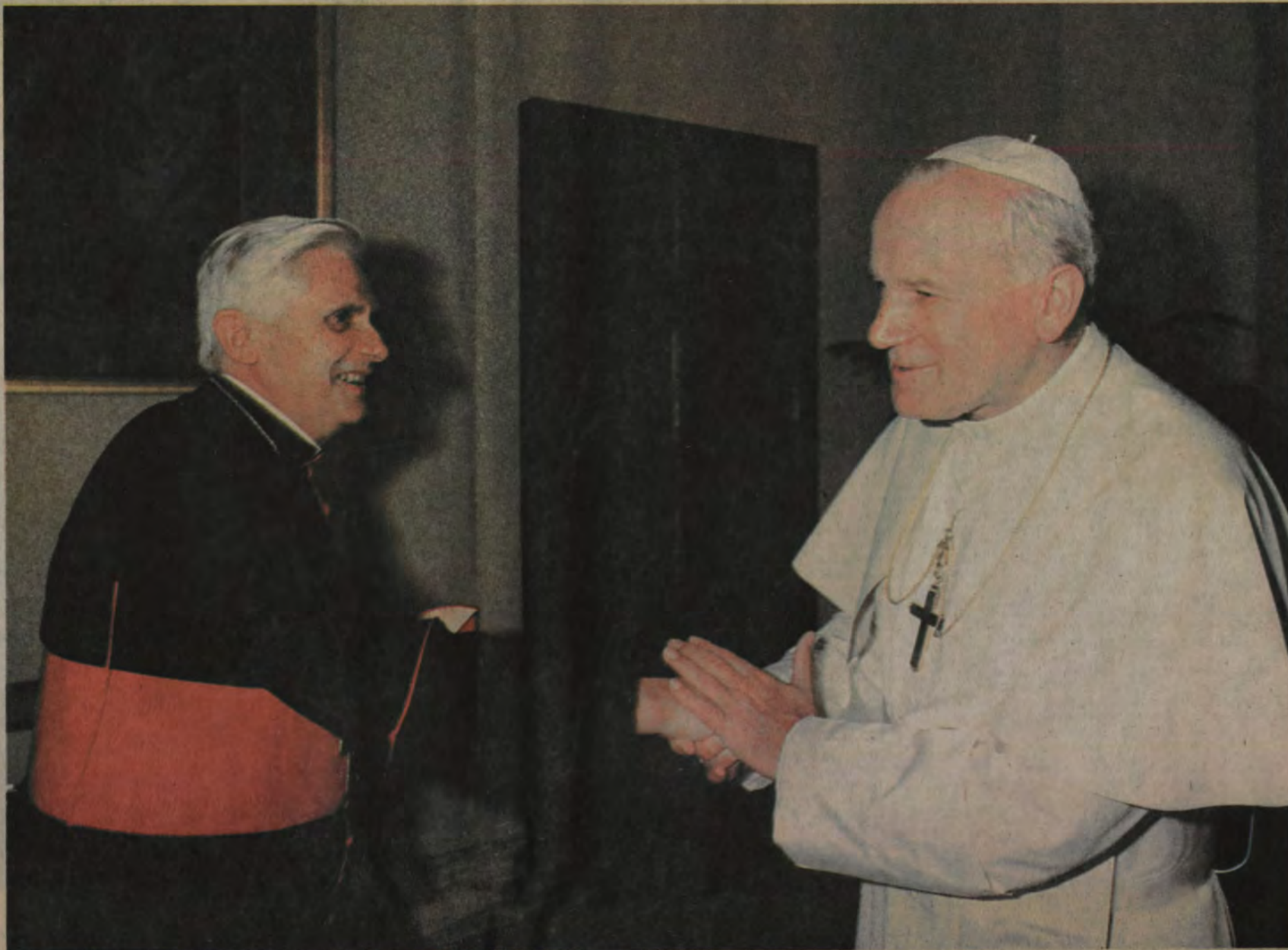
"Quizás apuntamos aquí al problema crucial de la teología y la pastoral de hoy. La «verdad» apareció de pronto como una pretensión demasiado alta, un «triumfalismo» que ya no podía permitirse".

re ha dado de la retractación de su asentimiento. Declaró que ahora había comprendido que el acuerdo suscrito apuntaba solamente a integrar su fundación en la "Iglesia del Concilio". La Iglesia Católica en comunión con el Papa es, para él, la "Iglesia del Concilio" que se ha desprendido de su propio pasado. Parece que ya no logra ver que se trata sencillamente de la Iglesia Católica con la totalidad de la Tradición, a la que también pertenece el Concilio Vaticano II.