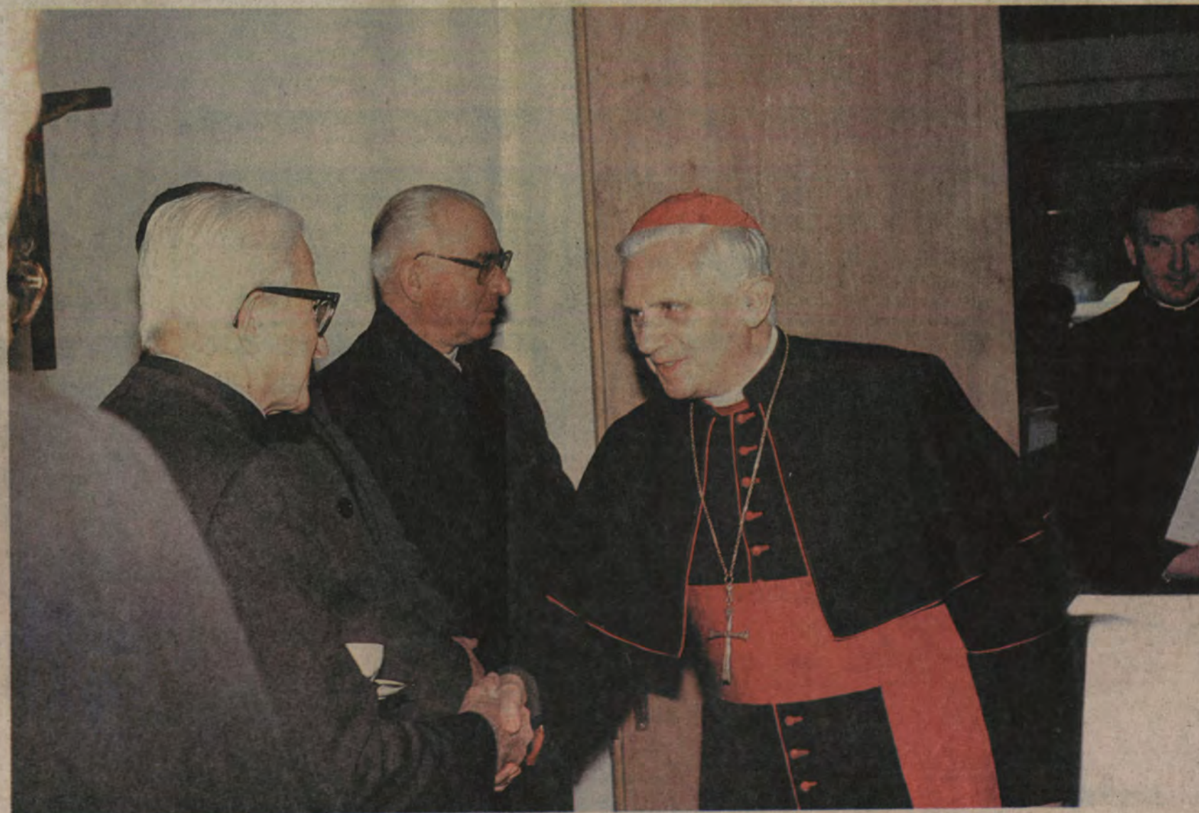
"Sería demasiado cómodo dejarse llevar por una especie de triunfalismo, y pensar que este problema ha dejado de serlo desde el momento en que el movimiento de Lefebvre se ha separado netamente de la Iglesia. Un cristiano nunca puede ni debe alegrarse de una desunión. Aunque con toda seguridad la culpa no pueda achacarse a la Santa Sede, es nuestra obligación preguntarnos qué errores estamos cometiendo".