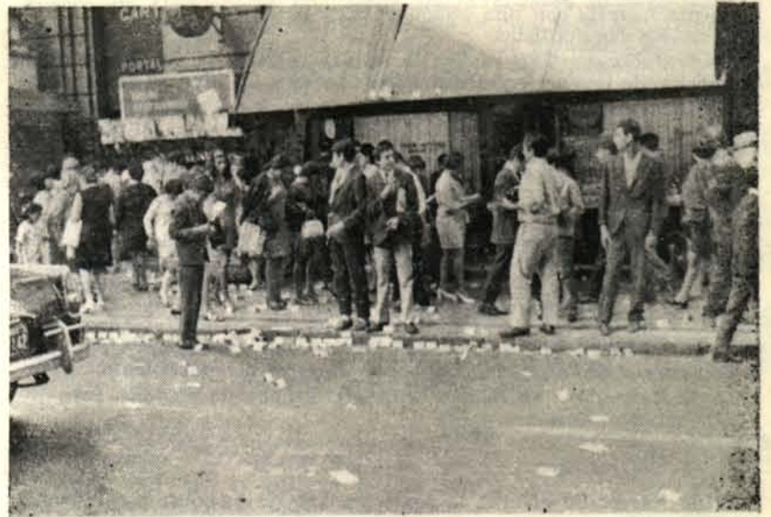
En los días en que el Gobierno, intensificando la persecución a través de la Reforma Agraria, estimulaba la violencia, la TFP realizaba una exitosa campaña lanzando 100.000 originales volantes de forma triangular llamando a la legalidad y a las elecciones.