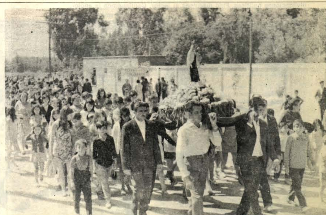
Campeños del valle de Curacavi llevan sobre sus hombros el anda con la imagen de Nuestra Señora del Carmen, que desde ese día quedó expuesta a la veneración pública en la calle central del pueblo. Los siguen varios centenares de personas que quieren testimoniar su devoción a la Reina de Chile.