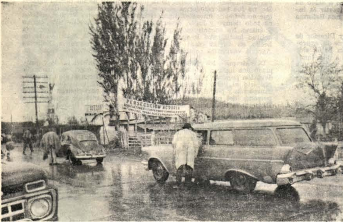
En el mes de Mayo, cuando la opinión pública había sido alertada sobre las persecutorias expropiaciones de la CORA en Curacaví, los agricultores de la zona y militantes de la TFP ligados a la agricultura invitaban a los automovilistas que pasaban frente a los fundos expropiados para visitarlos y comprobar personalmente el alto estado de producción y condiciones de trabajo en que éstos se hallaban.