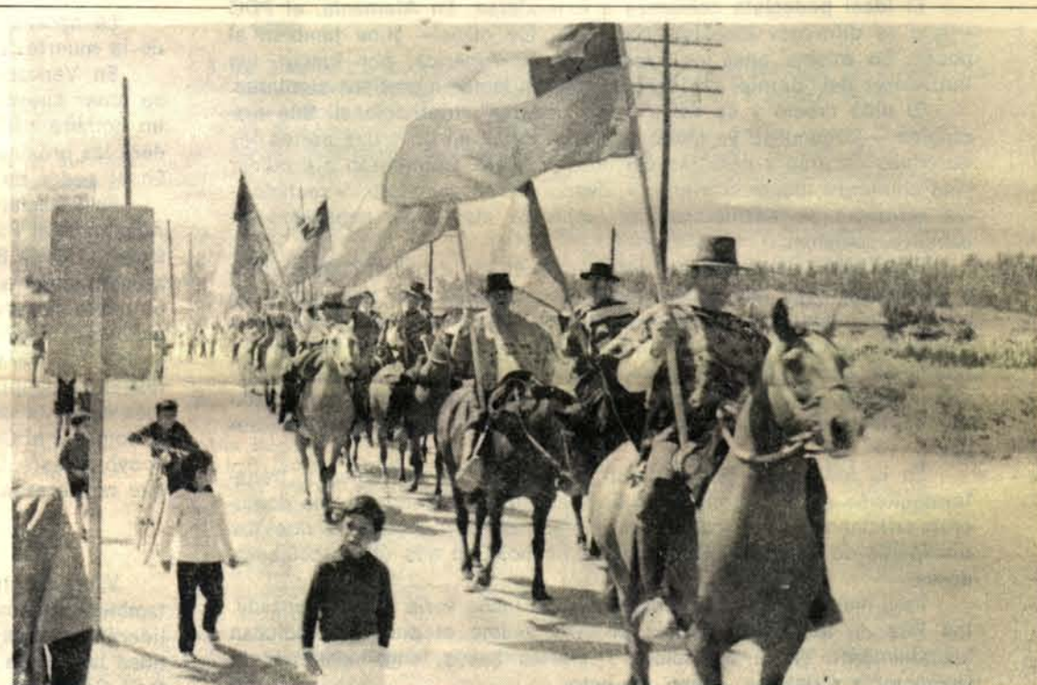
Huasos a caballo preceden la procesión de Nuestra Señora del Carmen en el recorrido desde las afueras hasta el centro del pueblo de Curacavi.