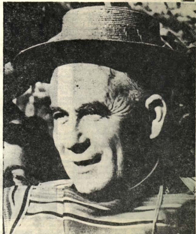
Emmo. Sr. Cardenal Silva Henríquez, que elogió la Reforma Agraria, distinguió a Neruda y autorizó a los católicos para votar por los marxistas...

24 de Diciembre: Aproximándose las elecciones, aparece en "Ultima Hora" y "Clarín" una declaración del Cardenal Arzobispo de Santiago, dando libertad a los católicos para votar por los candidatos marxistas.