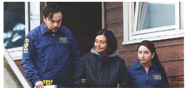
Foto 15: Noviembre 2015. Se formaliza solicitud de extradición de "Comandante Ana" ante Cancillería india.