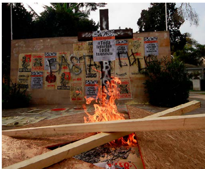
Imagen: Tumba Jaime Guzmán Errázuriz

Por sus ideas. Lo mataron sin que él, en su vida, hubiera empuñado un arma o usado la violencia como instrumento de acción política. Él fue un signo de contradicción para su época. La firmeza, inteligencia y lealtad con la que defendió sus ideas causaban fastidio e incluso rencor en sus adversarios. Pero, a pesar de que sabía esto y de que recibió múltiples amenazas, nunca cedió a la tentación de callar para evitar algún mal. Su valentía asombraba a todos. En él existía la convicción de que la vida sólo valía la pena vivirla por altos ideales y que cualquier traición a ellos era peor que la muerte. Era esa certeza y la seguridad de defender nobles principios morales lo que convirtió su sacrificio en martirio.