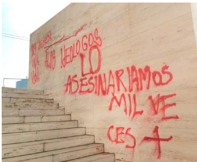
Imagen: "Nos deben una vida a los ideólogos, lo asesinaríamos mil veces más"