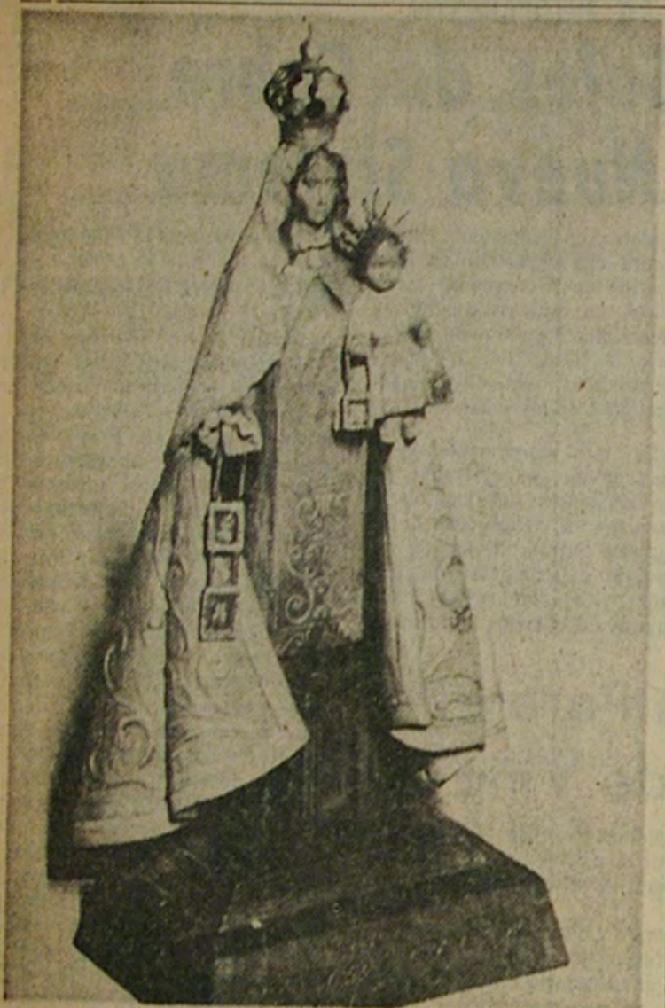
Imagen de la Virgen del Carmen que data del siglo XVIII y a la cual los libertadores Bernardo O'Higgins, José de San Martín y el pueblo de Chile hicieron solemne promesa que ayer se cumplió