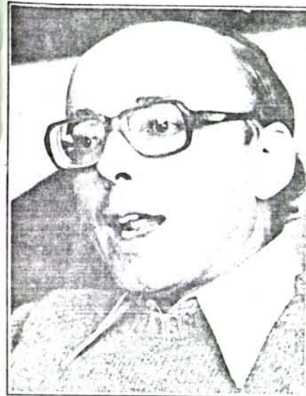
Jaime Guzmán Errázuriz

Una de las inquietudes que él tuvo siempre es que por no haber instalado oportunamente el Congreso, pueda ser que recobren fuerzas todas las tentativas por ampliar las facultades del parlamento o por mal utilizarlas, como ocurrió con la Constitución de 1925.