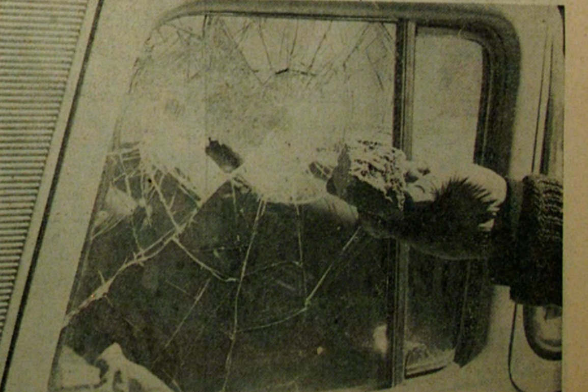
La ventanilla del vehículo es una prueba más de la violenta arremetida extremista estimulada por marxistas y demócrata-cristianos. Piedras como la que sostiene una mano en la foto fueron arma preferida de los revoltosos

—No os dejéis intimidar, porque la votación es secreta. Por muchas amenazas que recibáis, vuestro voto lo vais a manejar dentro de la cámara secreta y, en consecuencia, allí de nada valdrán las amenazas. —Por eso, tened confianza, esperad. En ese instante podréis determinar vuestros actos de acuerdo con vuestra conciencia y al votar por mí os liberaréis de las cadenas a que os tienen sometidos la política y la demagogia.