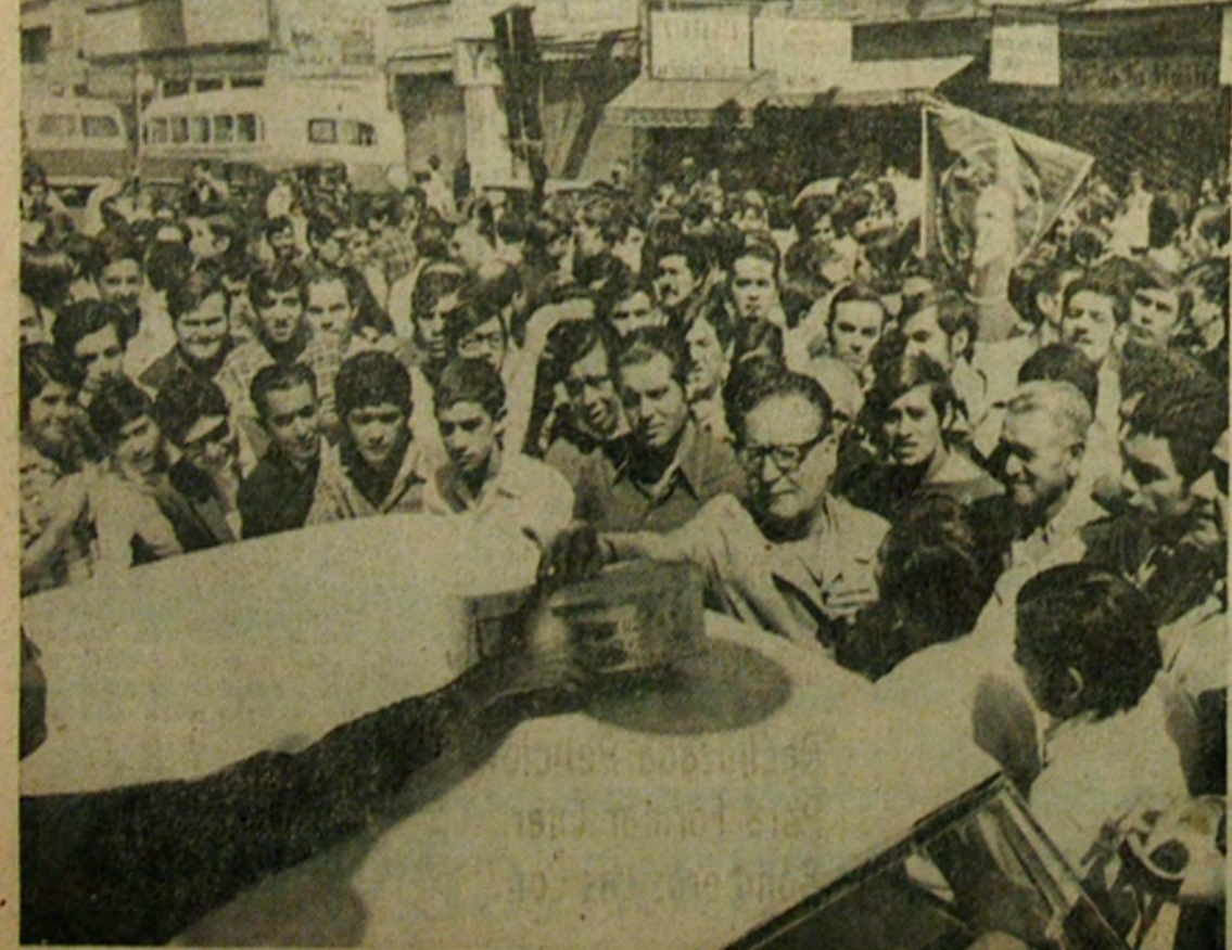
Salvador Allende, abanderado de la Unidad Popular, a la salida del pleno celebrado por la Juventud Socialista en el Teatro San Diego