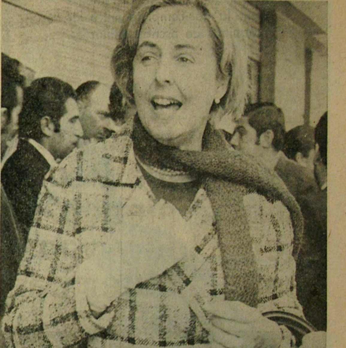
La diputada Silvia Alessandri recibió una herida cortante en Lota y aquí aparece con su mano derecha vendada. Su ánimo, sin embargo, se mostró entero en todas las jornadas alessandristas

toria aplastante que ya se divisaba, y que causa en los adversarios el grado de desesperación que impulsó estos insensatos actos de violencia. Concepción aportó más de 20 mil voluntades al día siguiente de los disturbios de Lota y Coronel, no obstante el clima de provocación, la propaganda radial y diarística que intentó sembrar el temor para limitar la asistencia masiva al mitin. Pocas veces en las triunfales giras de Alessandri por provincias se vio mayor fervor cívico en torno a su persona ni jamás candidato alguno fue escuchado con mayor atención y entusiasmo. Al día siguiente, cinco mil personas del centro industrial de Tomé recibieron a Alessandri con gritos de "¡No afloje, don Jorge!" y "¡No nos atajarán!".