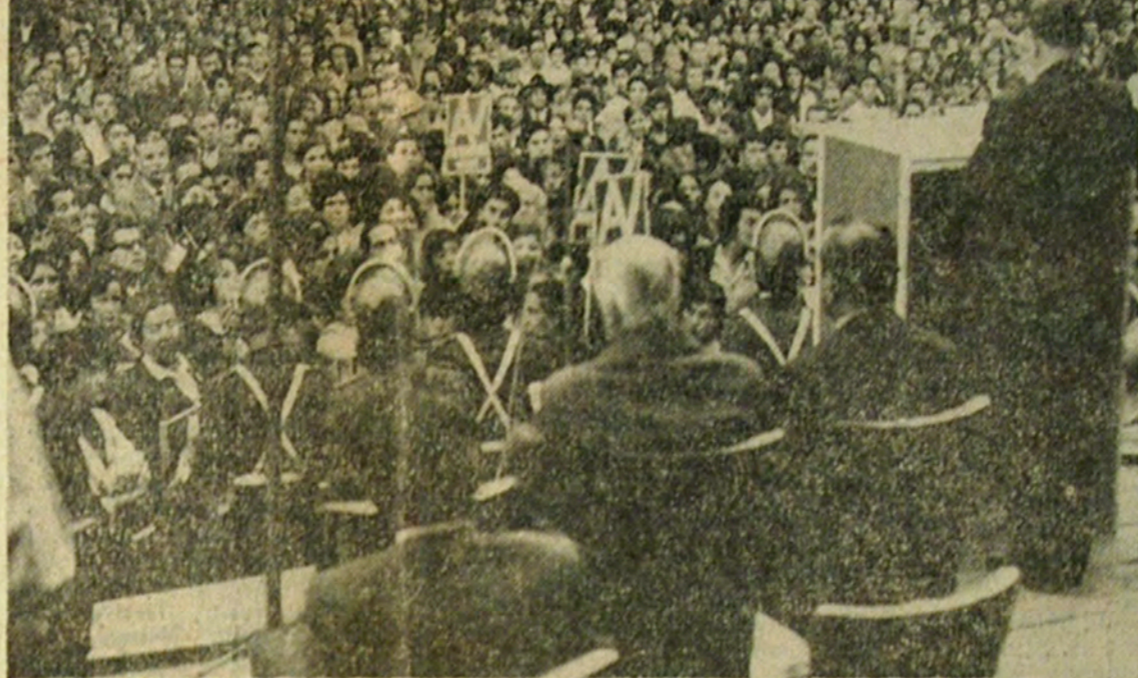
Aspecto parcial de la concentración alessandrista en la Plaza de Tomé, donde nuevamente se registraron actos de violencia contra el candidato presidencial independiente por elementos extremistas. La policía ha debido aumentar las medidas preventivas, como puede apreciarse en primer plano en la fotografía, donde aparecen varios carabineros con cascos

de los pueblos afroasiáticos, llaman a la juventud chilena a apoyar la lucha revolucionaria de los surcoreanos y acuerdan incorporarse a la jornada de solidaridad de ese pueblo que se realizará del 9 al 15 de abril. Acuerdan también redoblar la solidaridad con Cuba socialista y continuar participando en la zafra latinoamericana para contribuir a la producción de 10 millones de toneladas de azúcar en ese país y llaman también a conmemorar el centenario del nacimiento de Lenin. En sus puntos finales reiteran que "Ahora más que nunca la lucha armada continental es la más alta expresión de la lucha de clases y constituye la única vía de ascenso de los trabajadores al poder y declaran su solidaridad incondicional hacia los movimientos guerrilleros que luchan por el socialismo en todos los países latinoamericanos". HABLA ALLENDE El candidato Salvador Allende hizo mención a la situación internacional ya que sólo citó a Cuba como ejemplo y llamó al pueblo a convertir a Chile en "el segundo país libre de América Latina". Su discurso se refirió especialmente a destacar su admiración por la juventud que se rebela contra el sistema y a incitarla a seguir luchando por obtener sus fines. —Si hay algo que caracteriza al mundo contemporáneo es la expresión de protesta y rebeldía de las juventudes que re-