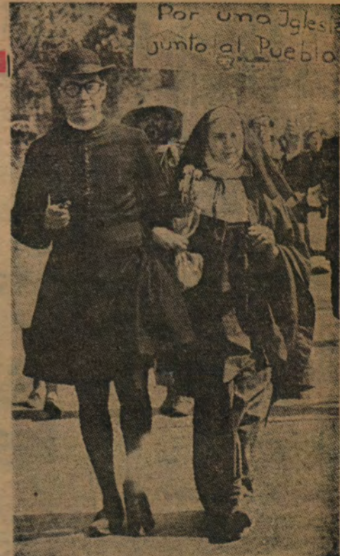
LA CHACOTA estudiantil también se hace eco de los problemas, como lo muestra este grabado en que van en cohesión una curita y una monjieta. Lo mismo, la alegría y el desprejuicio, revelan los monos que siguen hacia abajo en esta columna.