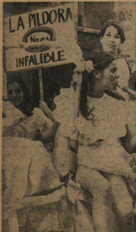
LA PILDORA No es INFALIBLE

El propio Rector, dirigiéndose a la Comunidad Universitaria, declara que la Universidad no debe continuar "sirviendo como instrumento de poder de una sociedad deshumanizada por injusticias estructurales" ni "confundir su función social con la defensa del sistema establecido". Las autoridades académicas hablan de "servir al pueblo" y especifican que la UC "no es una institución evangelizadora". "Los alumnos colocan en la facha-