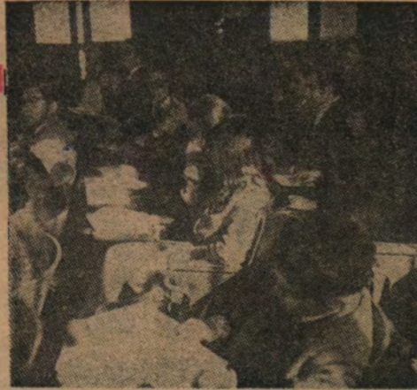
LA MUCHACHADA en clases, porque no todo es discutir, así como tampoco es cierto que porque los muchachos piensan y debaten ideas dejan de estudiar para transformarse en buenos profesionales.

Alguien pudo imaginar alguna vez que las muchachas que estudiaban en la muy pia y pontificia Universidad Católica iban a chacotear públicamente con los asuntos sexuales?