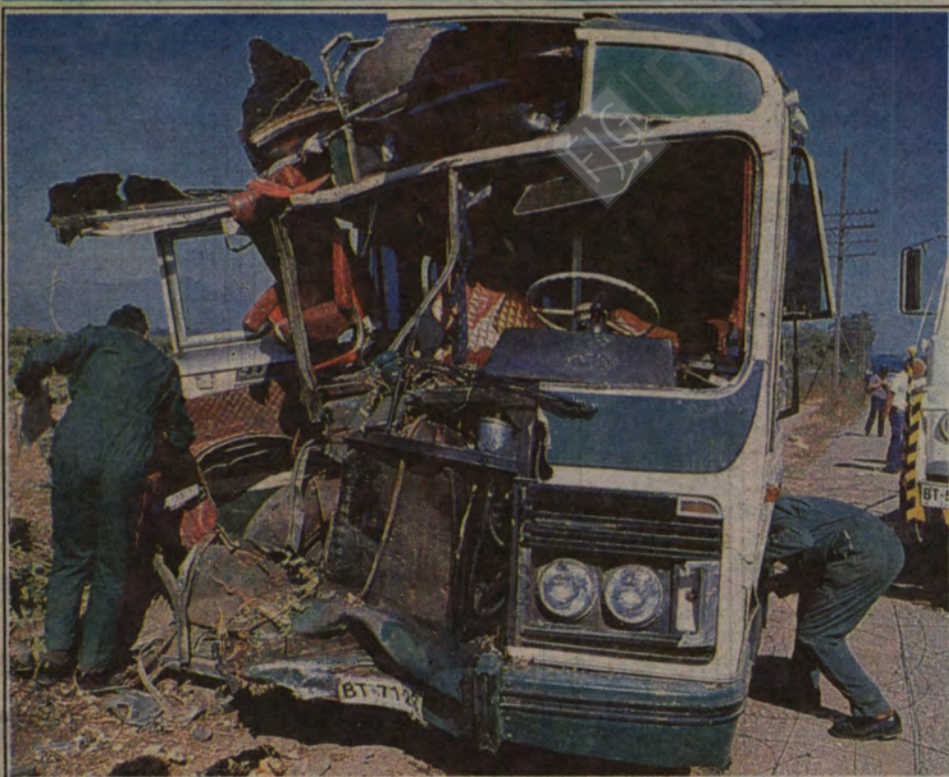
Treinta y nueve personas resultaron heridas en choque de un bus con un árbol, accidente ocurrido dos kilómetros al sur de Talagante y que se debió a la rotura de la barra de dirección. La revisión técnica había sido aprobada 48 horas antes (página 23). Derecha,