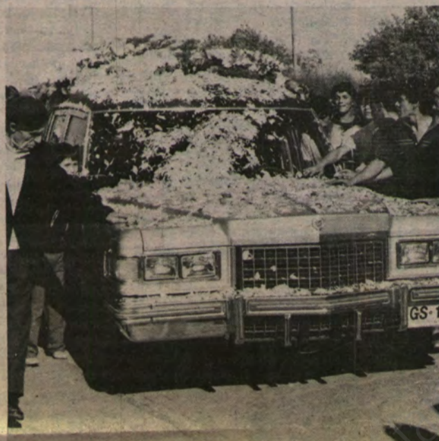
Pétalos de flores cubrieron la carroza fúnebre.

A las 17 horas comenzó la salida. Autoridades, ministros, ex alcaldes. Afuera, celoso resguardo policial. Adentro, comentarios, micros llenas, dolor.