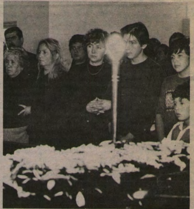
Los familiares siguieron en silencio el réquiem.