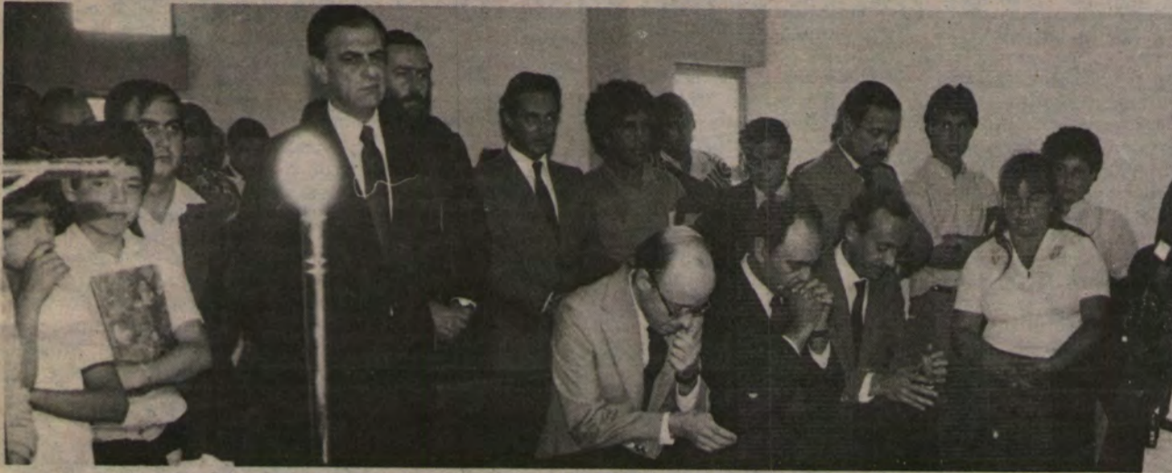
Los líderes de la UDI comulgaron y oraron por el descanso del alma de su correligionario.