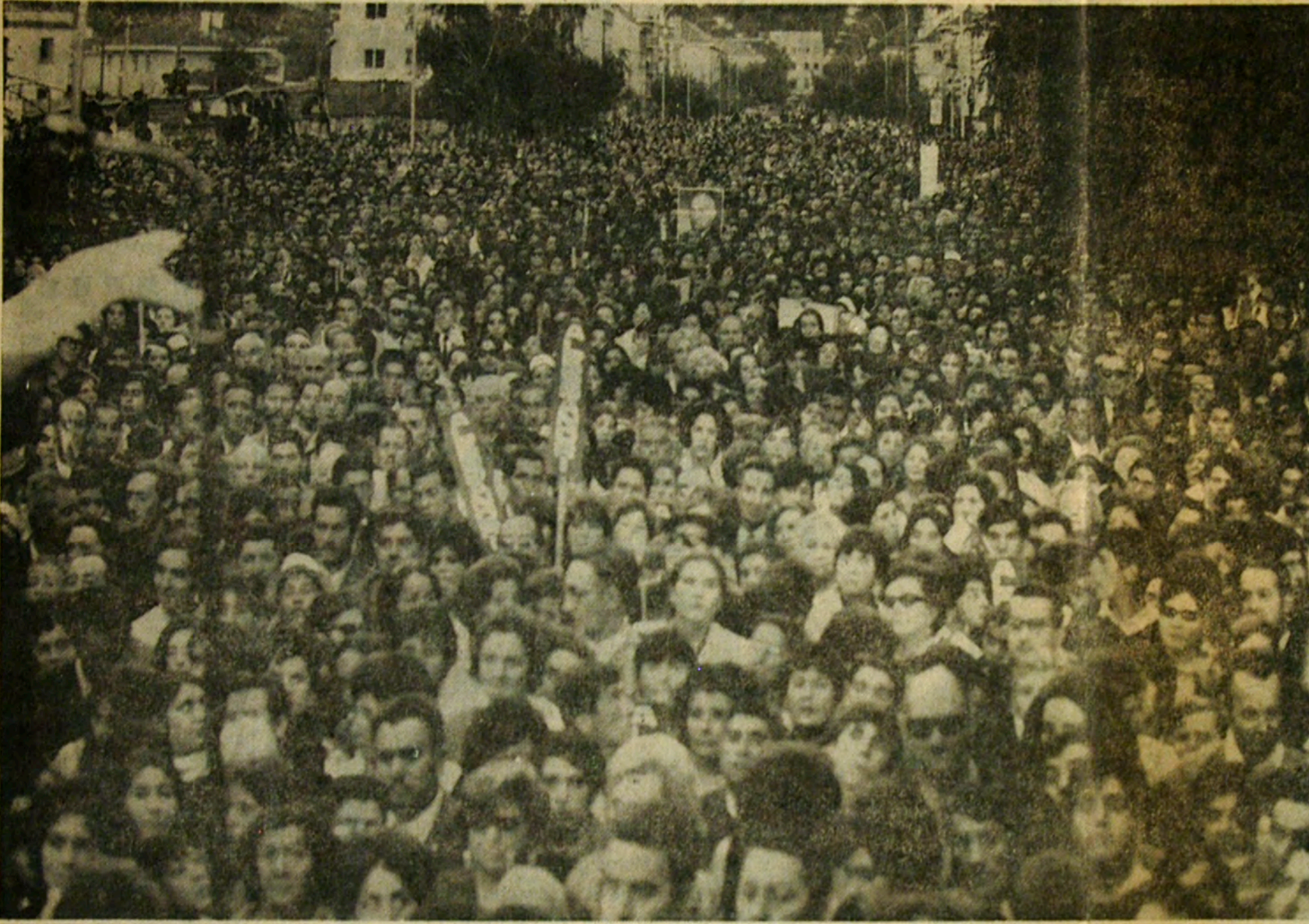
CONCEPCION.— Parte de los manifestantes que asistieron, el viernes último, a la proclamación del candidato independiente Jorge Alessandri Rodríguez, en esta ciudad. Alrededor de 20 mil personas concurrieron a ella, pese a las amenazas de sectores adversos a esta postulación y a los actos de violencia que se cometieron con el fin de intimidar a sus partidarios

LA PROPAGANDA MAS EFICAZ, de costo mínimo y en el diario de mayor circulación en Chile, la obtendrá usted por intermedio de los AVISOS ECONOMICOS de "El Mercurio".