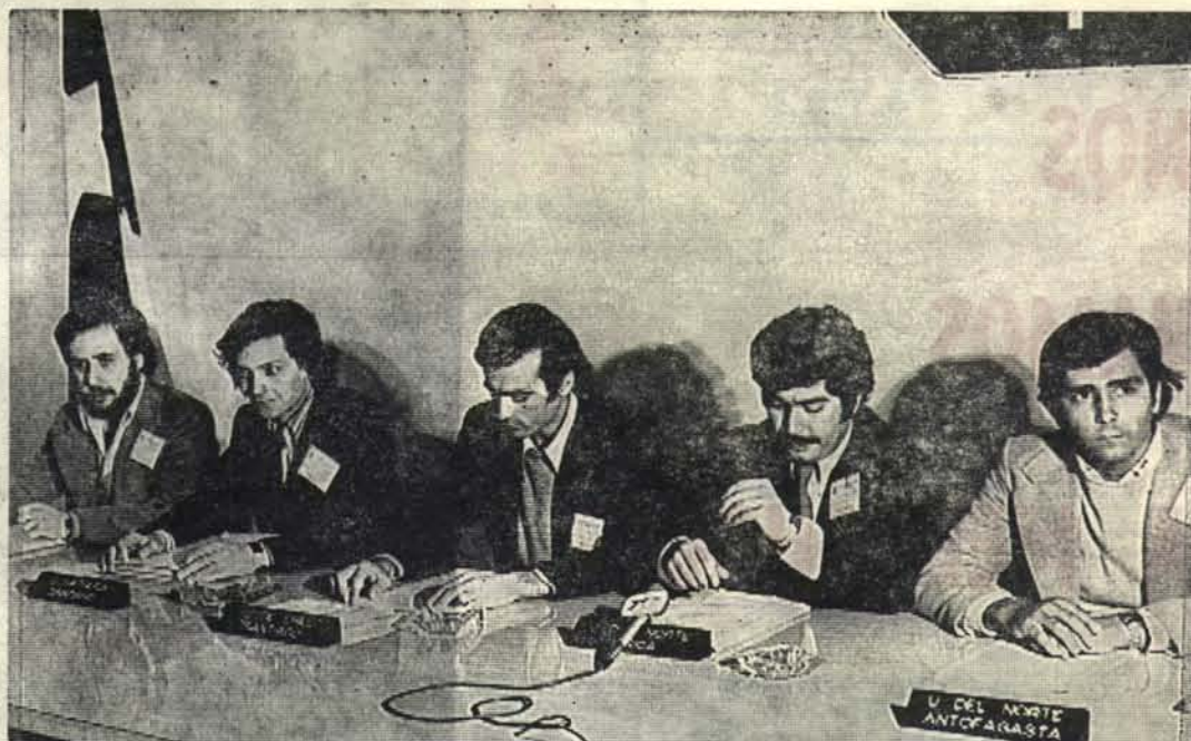
Conferencia de Prensa ofrecida por los Delegados.

Es tal vez, el hecho más significativo producido en el ámbito del movimiento estudiantil chileno, en mucho tiempo.