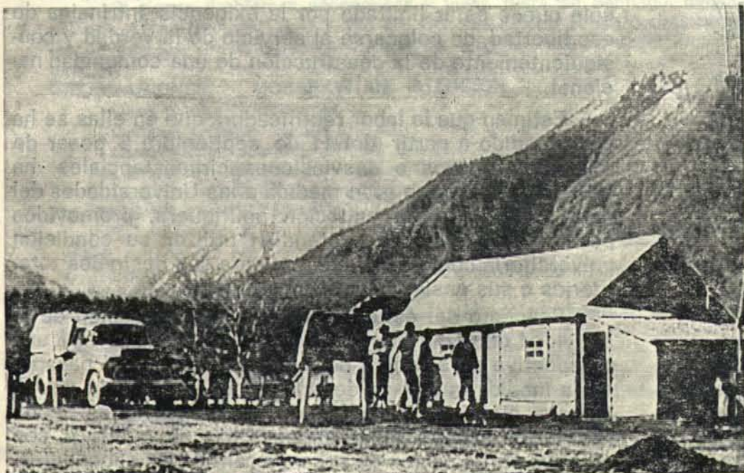
COMUNIDAD EL ESCORIAL.