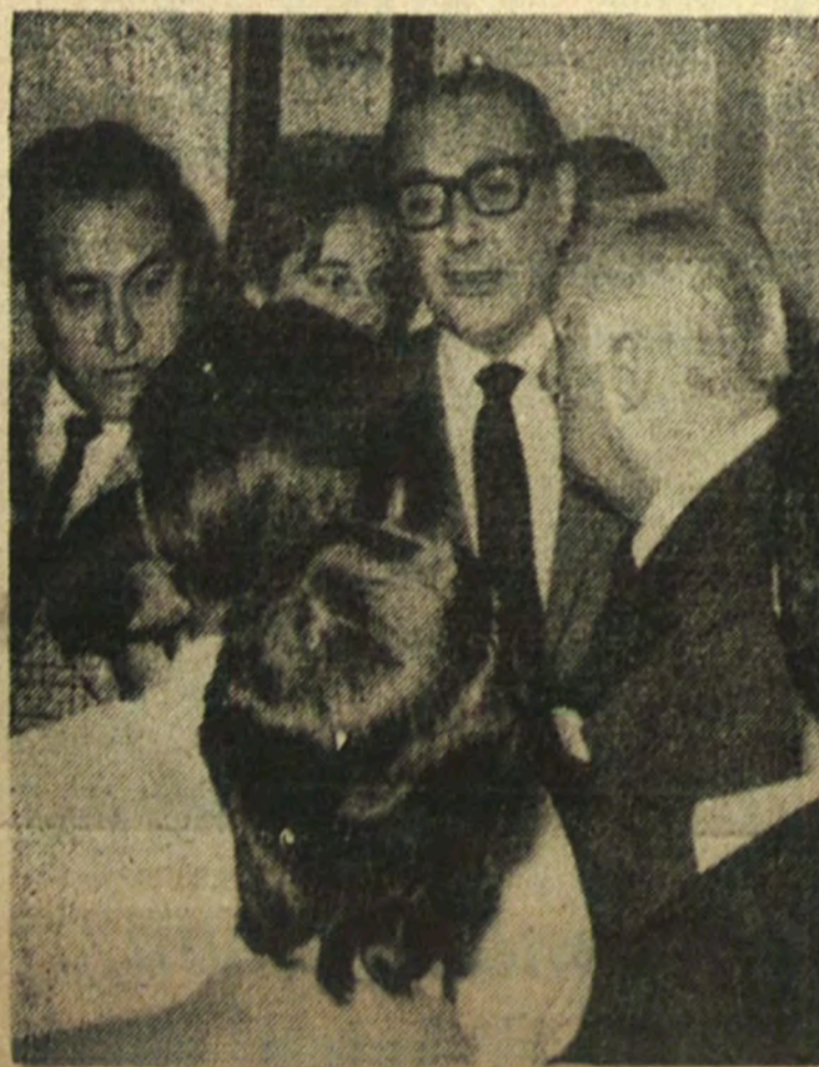
EL SENADOR Francisco Bulnes, que interrumpió el normal desarrollo de la conferencia de prensa de ayer de Alessandri, discute con los periodistas, en los momentos en que el postulante presidencial abandona el recinto sin finalizar la reunión con los representantes de órganos informativos.

Temprano fueron cerradas, en la tarde de ayer, las sedes de los diferentes partidos políticos en Concepción. Los locales estaban custodiados por personal policial, en prevención de cualquier tipo de manifestaciones violentas.