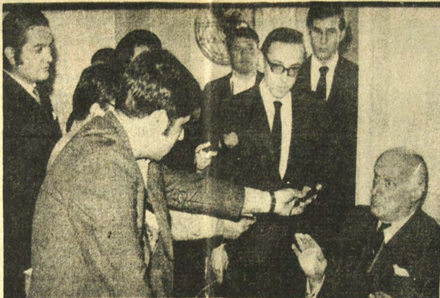
VISIBLEMENTE descontrolado, el candidato presidencial Jorge Alessandri espera a los periodistas: "Yo no he citado a ninguna conferencia de prensa".