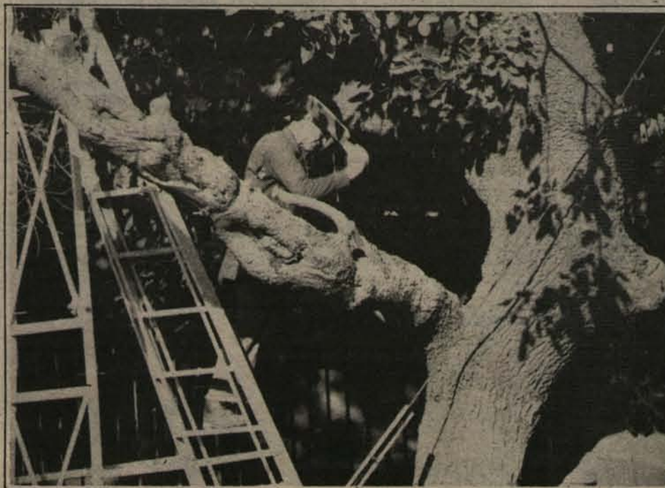
A machetazos derribaron este árbol en Beauchef y Blanco Encalada, sin tener en cuenta la gran utilidad que ha prestado y que puede seguir entregando en la lucha contra el smog, que envenena la atmósfera de la capital.