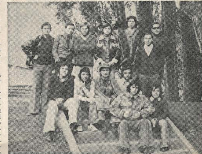
Dirigentes de la Primera, Segunda y Tercera comunas de Santiago