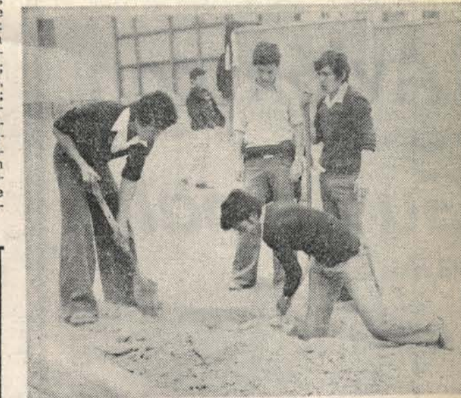
Dirigentes comunales juveniles en pleno trabajo social