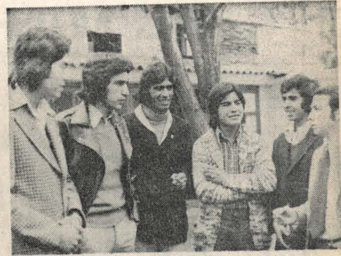
Representantes juveniles de la comuna de San Miguel