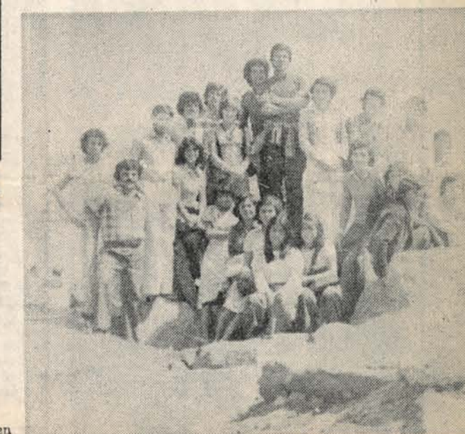
Un grupo de dirigentes juveniles de Valparaíso, representantes de la V Región