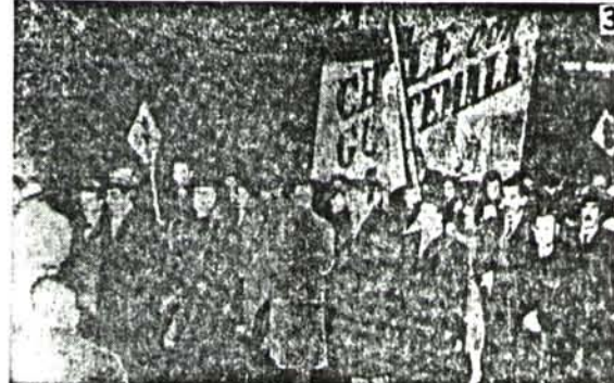
Frei, Allende y Neruda desfilan juntos en un acto político. Siempre amplitud y siempre oportunidad para pactar con quien sea.

Formando los comunistas parte del Gobierno en el año 1947, Frei opinaba: "Rechazamos la doctrina y la táctica comunista. Pero ante el comunismo, vemos que hay algo peor: el anticomunismo". "Se dice por los anticomunistas que el Partido Comunista promueve la lucha de clases, pero olvidan, los que esto dicen, que la lucha de clases es un fenómeno universal consecuencia del régimen en que vivimos, y en ella los cristianos debemos estar por la redención del proletariado". "Frente al problema de la ilegalidad del comunismo, debemos recordar que los partidos se definen por sus actuaciones y el Partido Comunista actúa conforme a la Constitución y a la Ley". (Diario "El Siglo", 28-6-47)