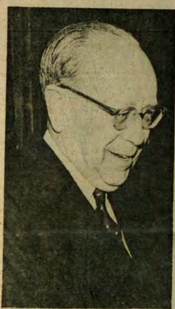
D. Arturo Alessandri Rodríguez, eminente jurista fallecido ayer

El señor Arturo Alessandri fue presidente de la Comisión Actualizadora de los Códigos de Chile, dependiente de la Facultad de Ciencias Jurídicas y Sociales de la Universidad del Estado. Dicha Facultad, conjuntamente con el Consejo de la Editorial Jurídica de Chile, acordó en fecha reciente, publicar un libro en su homena-